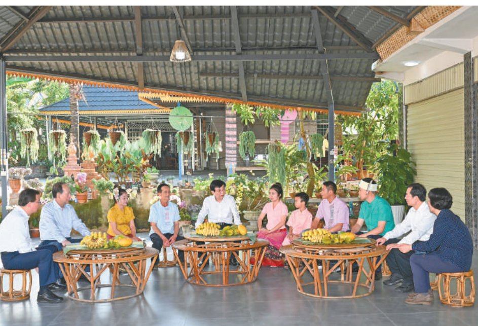
12月17日，王沪宁在西双版纳傣族自治州景洪市曼景罕居民小组看望傣族群众，并同当地干部群众交流。

新华社昆明12月20日电 中共中央政治局常委、全国政协主席王沪宁17日至19日在云南调研。他表示，民族宗教工作是党治国理政必须做好的重大工作，要认真学习贯彻习近平总书记关于加强和改进民族工作的重要思想，关于宗教工作的重要论述，坚持铸牢中华民族共同体意识的主线和我国宗教中国化方向，以高度责任感和使命感做好民族宗教工作，