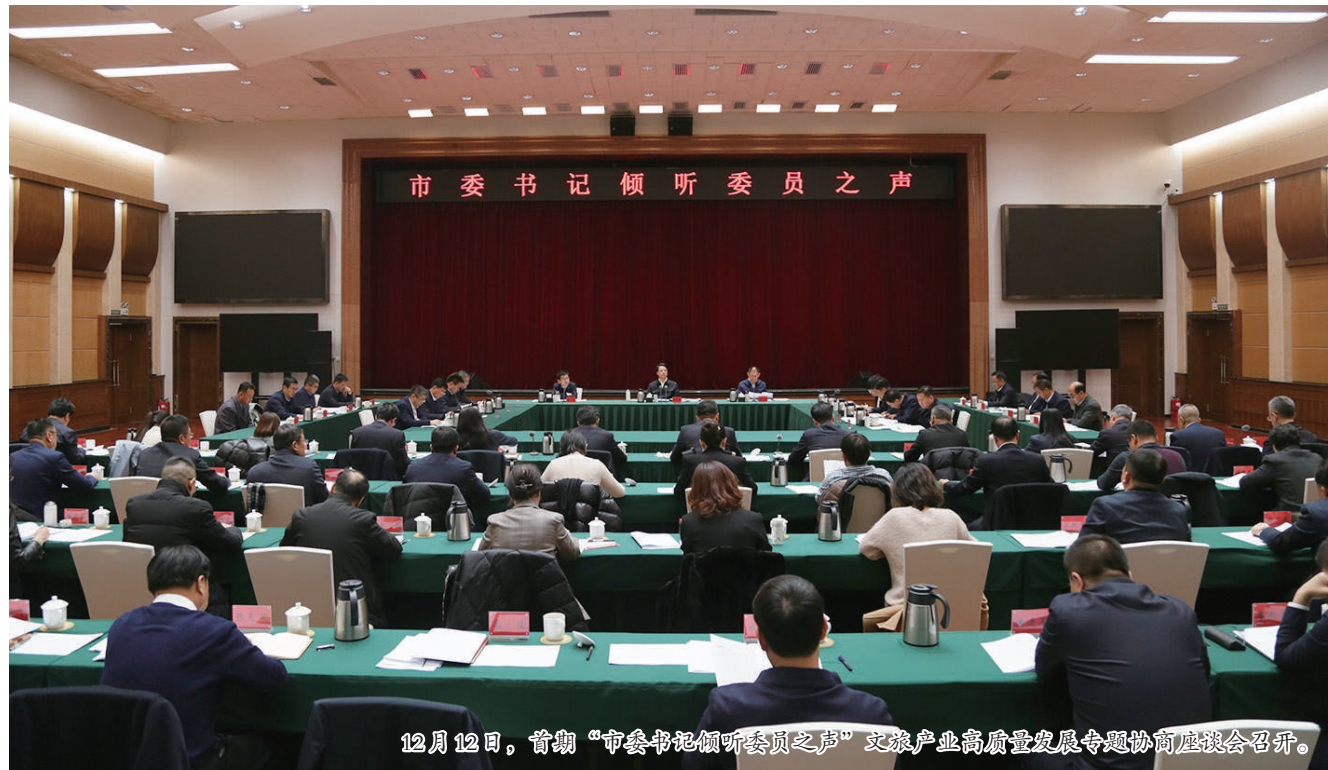
12月12日，首期“市委书记倾听委员之声”文旅产业高质量发展专题协商座谈会召开。

近年来，兰州市不断创新文化传播方式，增强兰州历史文化的影响力。在图书出版方面，据不完全统计，目前编纂出版的关于兰州历史、文化类图书约有300多种。特别是2021年出版发行的《兰州通史》，编纂历时4年，共5