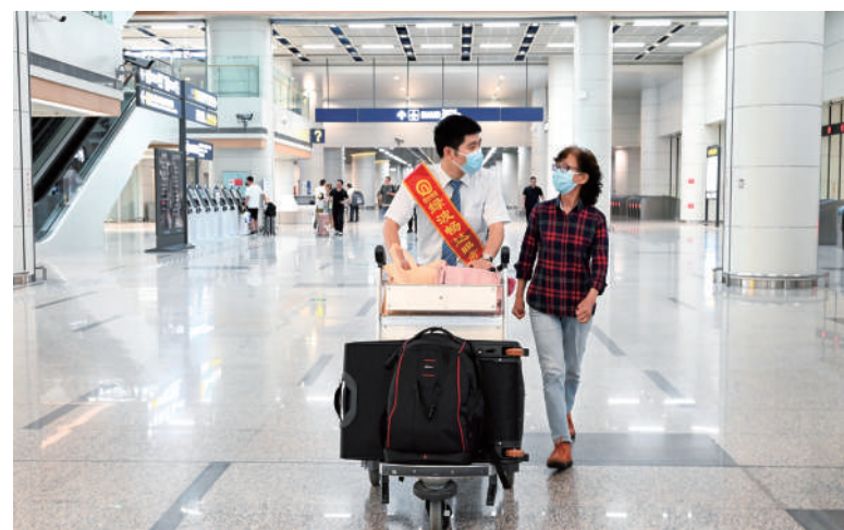
绿波畅达服务队队员服务乘客

青岛地铁深入践行“为城市建地铁、为人民建地铁”的初心使命,加快建设“轨道上的青岛”,始终坚持以“畅达幸福”为品质追求,以品牌创新生态引领建设世界一流地铁,持续延展“畅达幸福”品牌内涵外延,加快推进品牌高质量发展进程,为城市建设服务,为行业发展添彩,为人民幸福加码,全力绘就新时代轨道交通发展蓝图。