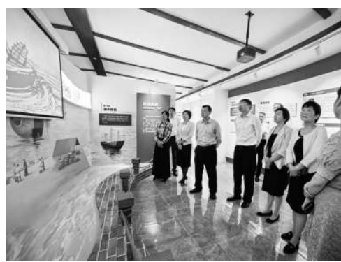
▲湖里区政协委员视察调研阅台文化交流馆