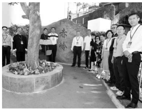
▲思明区厦港街道“好商量”工作室政协委员调研基层治理工作