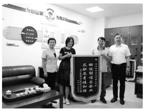
▲受助企业向海沧区政协社法委赠送锦旗