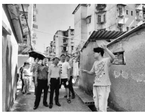
▲集美区政协杏林街道政协工作联络组开展微协商