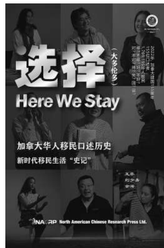
加拿大华人移民口述历史丛书