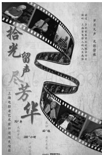
上海电影老艺术家口述历史