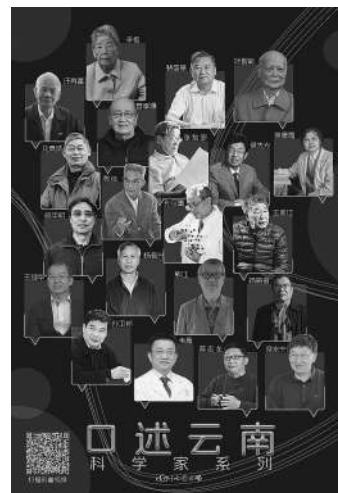
口述云南——科学家系列