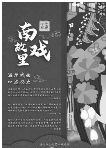
温州戏曲口述历史