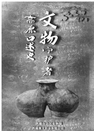
文物守护者高原口述史