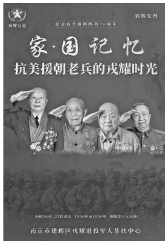
家·国记忆——抗美援朝老兵的戎耀时光