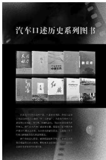
汽车口述历史系列丛书