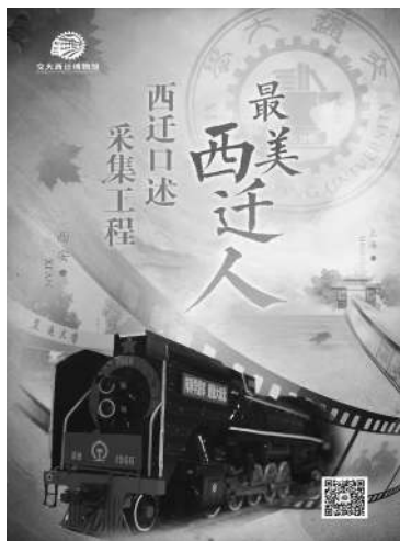
交通大学西迁口述采集工程