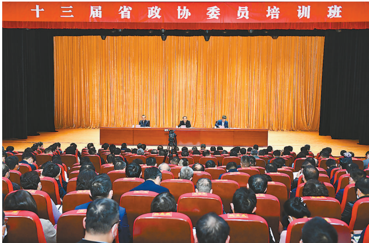
2023年4月7日，十三届安徽省政协委员培训班开班。

安徽工作的重要讲话重要指示等，党组成员带头开展主题宣讲，开展12次集体学习研讨，举办专题读书班、专题报告会、委员讲堂以及委员读书会活动，“读、听、看、思、讲、用”抓实抓细理论学习，感悟思想伟力、增强奋进动力，坚定不移沿着习近平总书记指引的方向前进。