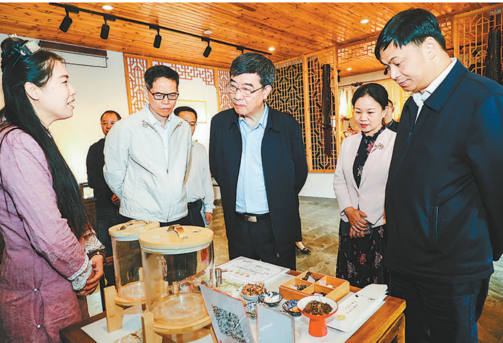
2023年5月24日，安徽省政协赴浙江省考察传统村落保护利用工作。

2023年以来，安徽省政协严格落实“第一议题”制度，完善政协学习制度体系，跟进学习贯彻习近平总书记重要讲话指示批示、深入学习贯彻习近平总书记关于加强和改进人民政协工作的重要思想、全面学习贯彻习近平总书记关于