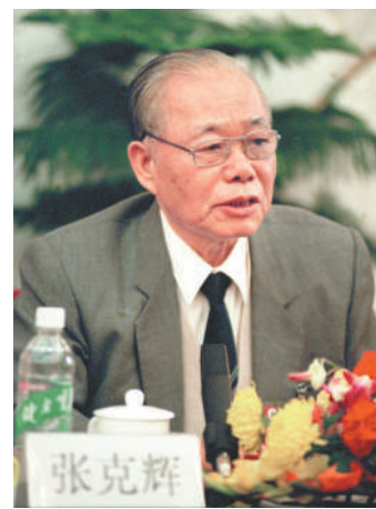
左图：1998年3月6日，张克辉同志参加全国两会新闻中心举行的首次记者招待会。