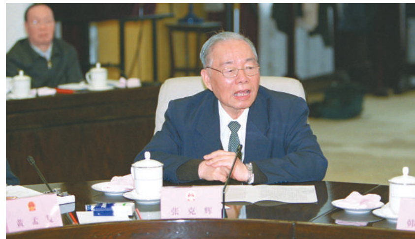
下图：2003年4月11日，张克辉同志在国务院召开的座谈会上发言。