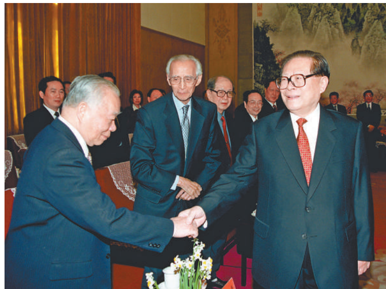
上图：2002年2月8日，中共中央举行党外人士迎春座谈会。这是江泽民同志和张克辉同志握手。