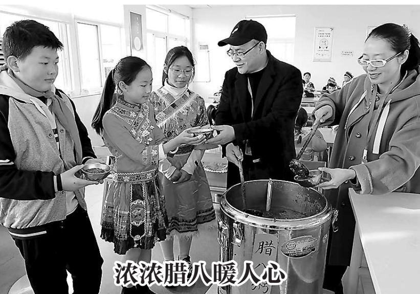
▲近日，在浙江省温岭市新河镇高桥小学，政协委员把一碗碗热气腾腾的腊八粥送到学生们手里。据悉，温岭市政协新河委员联络组经常在学校开展各类“送文化、送温暖”活动，让学生们感受到“民族一家亲”的温暖。

1949年2月20日，宋庆龄致函中共中央，信中说：“亲爱的朋友们：请接受我对你们极友善的来信之深厚的感谢。我非常抱歉，由于有炎症及血压高，正在诊治中，不克即时成行。但我的精神是永远随着你们的事业。我深信，在你们英勇、智慧的领导下，这一章历史——那是早已开始了，不幸于二十三年前被阻——将于最近将来光荣的完成。”