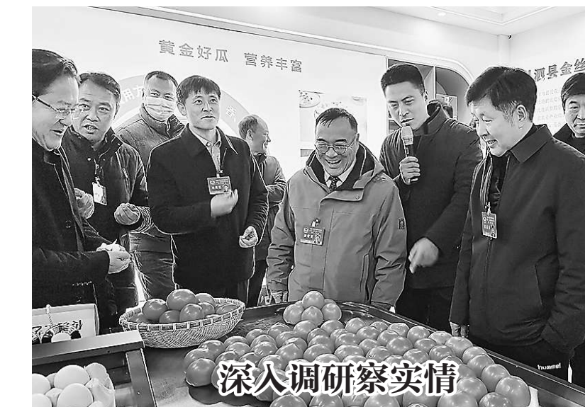
▲安徽省宿州市泗县政协积极搭建知情明政平台，经常性组织各界别委员通过学习培训、视察调研等活动，让委员在掌握民情、了解民意的基础上撰写出高质量的提案。图为委员们调研辖区企业生产运营情况。