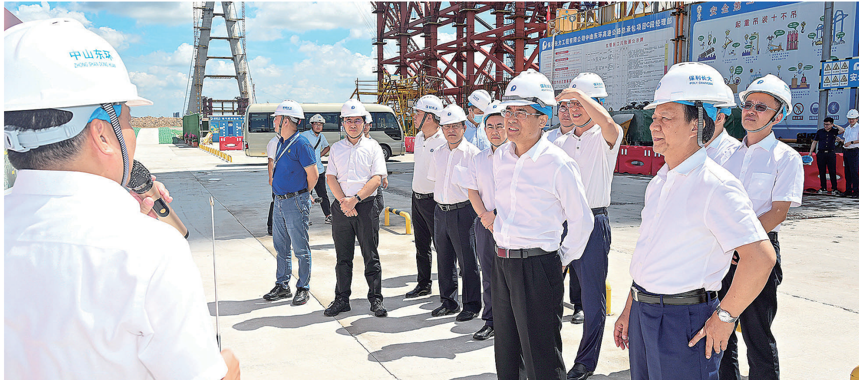
广东省政协调研组到中山市、珠海市开展提案督办和专题调研。

着眼抢占新兴产业、未来产业新赛道，省政协还围绕发展新质生产力、人工智能、生物医药等前瞻性课题，召开6次“主席·专家深聊会”，及时向全国政协及省委报送重要信息，助力打造广东制造新支柱。