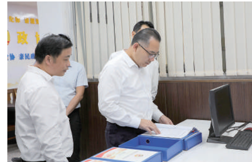
广东省政协调研组赴佛山市，围绕“强化企业科技创新主体地位，构建全过程创新生态链”开展专题调研。