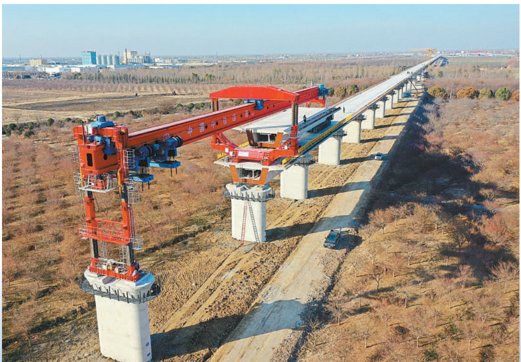
▲ 1月15日，安徽省蒙城县境内阜淮铁路2标施工现场，来自中铁四局的铁路建设者正在进行箱梁架设作业，目前项目建设稳步推进。阜淮铁路位于安徽省北部，途经阜阳、亳州、宿州、淮北，正线全长约142.5公里，设计时速350公里，预计2026年建成。项目建成后，对于推动皖北地区振兴发展，更好支撑长三角一体化发展、中部地区崛起等具有重要意义。