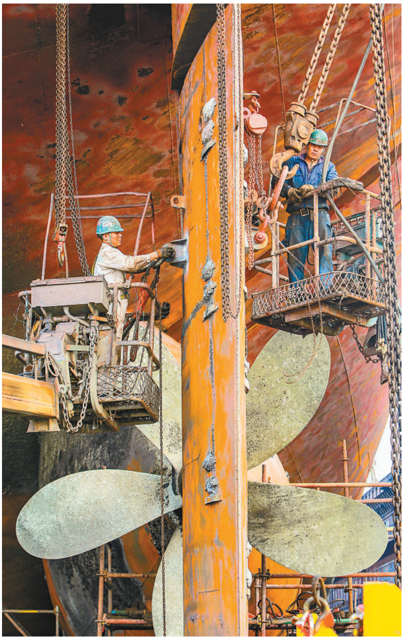
▲ 近日，广东远洋海运重工码头，工人们在船坞紧张有序的维修船舶，一派忙碌景象。