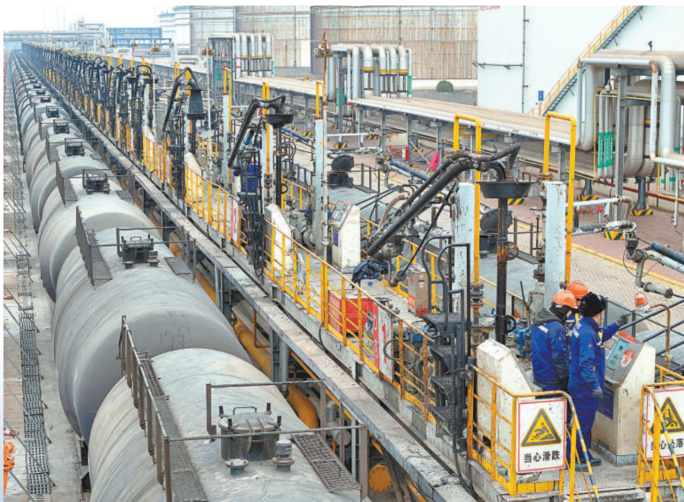
▲ 近日，在山东港口烟台港龙口港区，工人在铁路罐车上进行油料加注检查。春节将至，山东港口烟台港“迎峰度冬”能源保供作业迎来高峰。近年来，该港积极放大“公铁水”立体集疏运体系优势，打造能源跨地区多式联运快速通道，全力保障国家能源供应稳定高效。