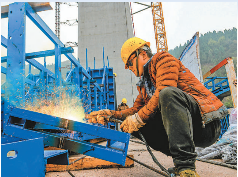
▲ 近日，重庆市丰都县名山街道两汇口社区渝（重庆）万（万州）高铁凉水井双线特大桥施工现场，中铁十七局工人在加班加点抢抓工程进度。渝（重庆）万（万州）高铁是我国铁路网中长期规划沿江高铁的重要组成部分，是西南地区连接中原地区、华东地区的主要客运快速通道。该工程总投资约527亿元，设计时速350公里，正线全长252公里，预计2025年建成通车。项目通车后，从重庆主城到万州的行程时间将由目前的1个半小时缩短至50分钟左右，对于助推“一带一路”与长江经济带的联动发展具有重要意义。