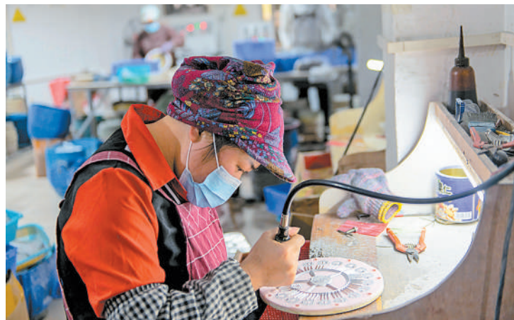
▲ 近日，在贵州省从江县洛香镇井当社区的广州贵龙饰品贸易有限公司从江井当分公司生茶车间内，工人正在赶制一批出口印度的饰品。近年来，从江县切实加强东西部协作力度，引进劳动密集型出口饰品生产企业入驻，产品畅销非洲、印度、阿拉伯等国家和地区。