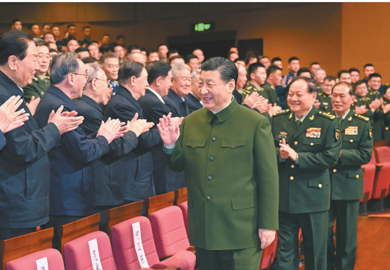
1月29日下午，中央军委慰问驻京部队老干部迎新春文艺演出在京举行。中共中央总书记、国家主席、中央军委主席习近平观看演出，向在座的军队老同志和全军离退休老同志致以节日问候和新春祝福。

新华社北京1月30日电（记者梅常伟）中央军委慰问驻京部队老干部迎新春文艺演出29日在京举行。中共中央总书记、国家主席、中央军委主席习近平观看演出，向在座的军队老同志和全军离退休老同志致以节日问候和新春祝福。