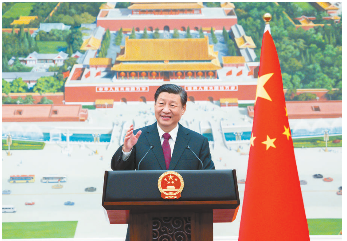
一月三十日下午，国家主席习近平在北京人民大会堂接受42位外国新任驻华大使递交国书。这是递交国书仪式结束后，习近平在北京人民大会堂对使节们发表集体讲话。

新华社北京1月30日电 1月30日下午，国家主席习近平在人民大会堂接受42位驻华大使递交国书。人民大会堂北门外，礼兵分列两侧，号手吹响迎宾号角。使节们相继抵达，穿过旗阵，沿汉白玉台阶拾级而上。在巨幅壁画《江山如此多娇》前，习近平分别接受使节们递交国书，并同他们一一合影。