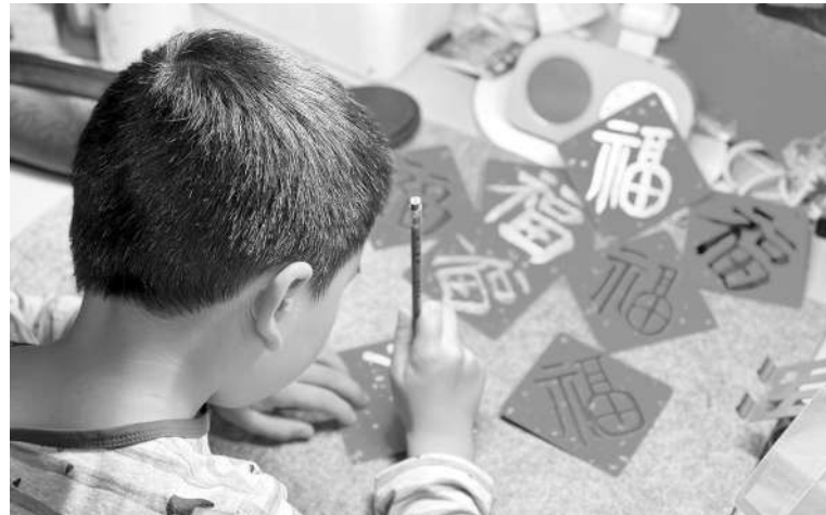
▲春节来临，小朋友正在写「福」字