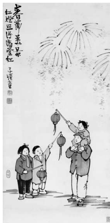
▲春节美景 丰子恺 作

每到春节来临，全国各地，舞龙舞狮歌舞游行，还有春联纳福、吃团圆饭、包饺子、剪纸、民乐表演等各类拜年庆祝活动异彩纷呈。民间有俗语云：“二十八，贴花花。”贴花花，包括春联、年画、福字、窗花等等。在它们的装点下，平日里以为寻常的房屋居所立时便充满了红红火火的节日气氛。