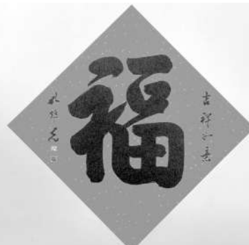
▲福 全国政协委员 孔维克 作

然和谐共生等全人类共同价值。而今，卯兔追冬去，辰龙迎春来！龙，相传为鳞虫之长，与凤凰、麒麟等并列祥瑞，是中华民族精神和文化的象征，自古以来备受尊崇，在十二生肖中的地位举足轻重。岁首遇祥龙，正是春光骀荡、国步龙腾、福满中华。