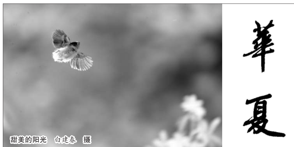
甜美的阳光