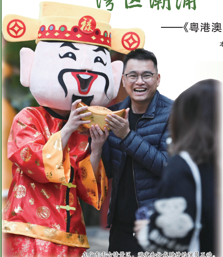
在广东千古情景区，游客和扮成财神的演员互动。

粤港澳大湾区市场加速融通、相互成就释放的是文旅消费新潜力、新场景，其背后则蕴含着纵深推进新阶段粤港澳大湾区建设的新愿景。