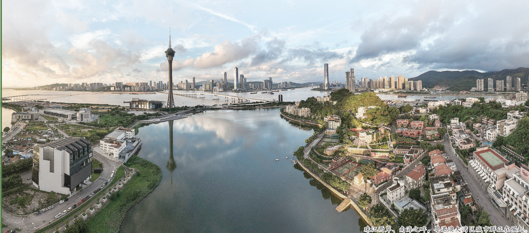
珠江两岸、南海之畔，粤港澳大湾区城市群正在崛起。

此外，他还建议，国家适时增加“自由行”签注城市数量，恢复深圳居民赴港“一签多行”，再探索珠海居民赴澳“一签数行”乃至“一签多行”，最后在大湾区实施赴港澳“一签数行”乃至“一签多行”，全面推进文旅互动和企业商务交流。