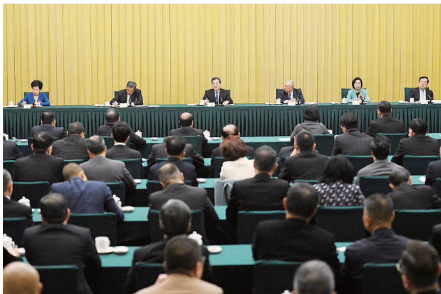
3月6日，中共中央政治局常委、国务院副总理丁薛祥参加全国政协十四届二次会议港澳地区全国政协委员联组会。