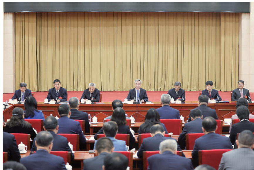
3月6日，中共中央政治局常委、中央纪委书记李希参加全国政协十四届二次会议九三学社、无党派人士界委员联组会。