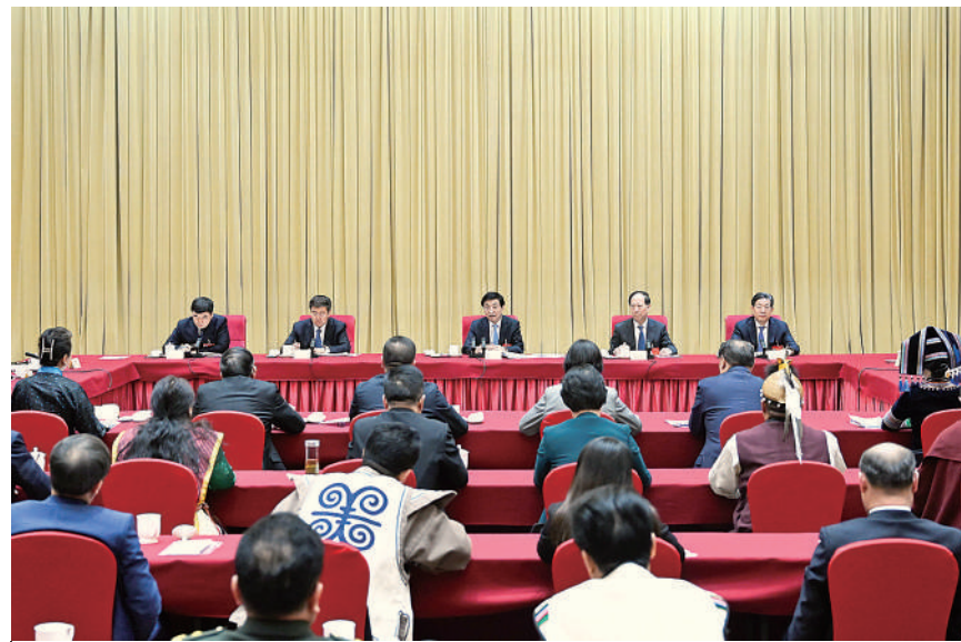
3月6日，中共中央政治局常委、全国政协主席王沪宁参加全国政协十四届二次会议少数民族界委员联组会。