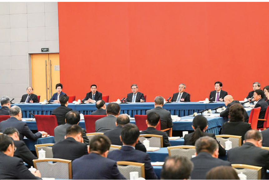
3月6日，中共中央政治局常委、国务院总理李强参加全国政协十四届二次会议经济、农业界委员联组会。