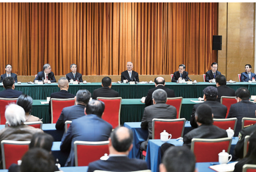
3月6日，中共中央政治局常委、中央书记处书记蔡奇参加全国政协十四届二次会议文化艺术、体育界委员联组会。