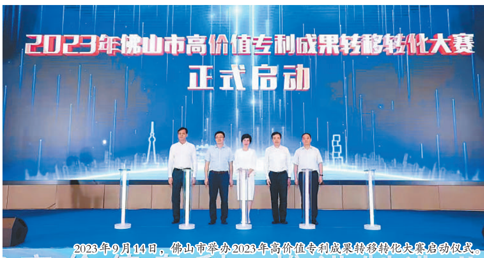
2023年9月14日，佛山市举办2023年高价值专利成果转移转化大赛启动仪式。

为吸引全国各地高价值专利成果到佛山转化落地，佛山市政府联合国家知识产权局知识产权发展研究中心举办高价值专利成果转移转化大赛。一是广泛征集，精准发动。在全国重点城市包括北京、深圳、香港等15个城市进行巡讲和宣传发动，吸引了清华大学等知名高校、科研机构、企业等432个项目参赛，技术领域覆盖高端装备制造、新一代信息技术等领域，有效满足佛山产业对创新技术的庞大需求。二是完善赛制，高效匹配。建立专利转移转化落地工作机制和项目评价体系，创新设计“8分钟路演+5分钟专家点评”的路演方式，为参赛团队提供