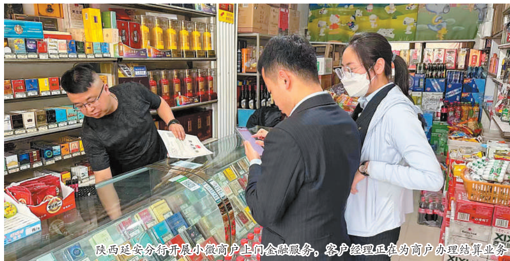
陕西西安分行开展小微商户上门金融服务，客户经理正在为商户办理结算业务。

助力企业降本增效，服务实体经济能力实现质的飞跃。对于金融科技所带来的经营成本下降，建设银行及时将其让利于小微企业客户，新发普惠金融贷款平均年化利率由2017年的超6%持续下调至目前4%以下。“按需支用、随借随还、按日计息”的还款方式，大大减少贷款资金占用。此外，建设银行还对小微企业减免或优惠超30项服务收费项目，进一步节省企业成本。疫情期间，累计为超44万户普惠小微客户提供延期还本贷款金额超2600亿元，帮助企业恢复发展，呵护最为广泛的实体经济基础。