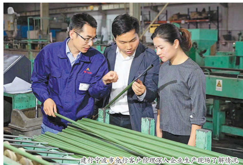
建行宁波市分行客户经理深入企业生产现场了解情况。

探索养老金融与普惠金融融合。聚焦养老产业小微企业特点，创新专属服务方案，积极支持企业成长发展。持续布局旅游、文化、体育、健康、教育等重点民生领域，把人民对美好生活的期待，变成建行人的行动自觉，精准滴灌幸福产业相关普惠客群，提升民生领域服务质量。