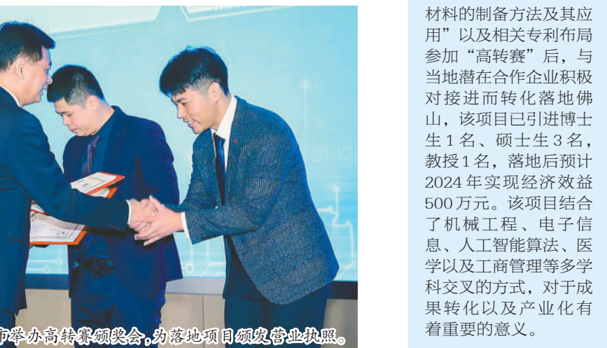
2024年1月17日，佛山市举办高转赛颁奖会，为落地项目颁发营业执照。