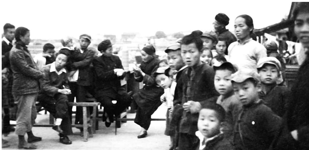
▼1955年底，谢雪红在福建调研，图为谢雪红与农民交谈。。

人大代表开展视察工作，最早是由张治中提议的。据张治中机要秘书余湛邦所写的回忆录《张治中与中国共产党》一书介绍：“1954年全国人大一届一次常委会开过后，张（治中）提出一项书面意见，主张每位常委每年都要出去视察，了解地方情况，听取群众意见。”