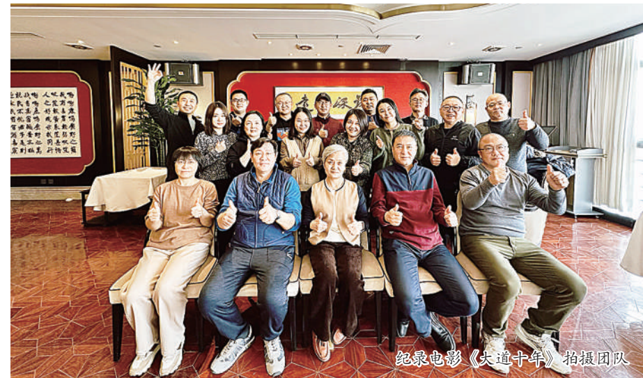
纪录电影《大道十年》拍摄团队

式致敬历史、融入历史、参与续写历史，与有荣焉，感恩满满。 《大道十年》的拍摄过程，对于每一个创作者来说，都会是一次难忘的经历和宝贵的财富，对我何尝不是如此？记得在影片首映礼后，有一位导演曾和我说：“特别感谢那些短暂无暇却真诚以待的岁月。更要感谢经历过的所有困难和挑战，因为这不仅仅是一次记录的旅程，更是一次心灵的洗礼。”我相信，她代表的是团队所有成员的心声，她也说出了我的心里话。 10年间，共建“一带一路”倡议从美好的蓝图变为壮丽的实景；不到1年间，一部记录这段历史的纪录片由我所参与的策划变为银幕上合力呈现的力作。两段历程，告诉着我同样的道理——“路虽远行则将至，事虽难做则必成”。顺便提一下《风从东方来》五集电视纪录片获国家广播电视总局2023年第四季度优秀国产纪录片。 在未来的日子里，我和我的“小伙伴们”都将记住这段宝贵经历。我们衷心祝愿共建“一带一路”结出更丰硕的果实，我也祝愿我们每个人的事业，“起于三寸之坎，以就万仞之深”，在平凡的岁月里，用热爱与赤诚累积起无愧于心、无愧于伟大时代的奉献。 （作者系全国政协办公厅新闻局副局长）