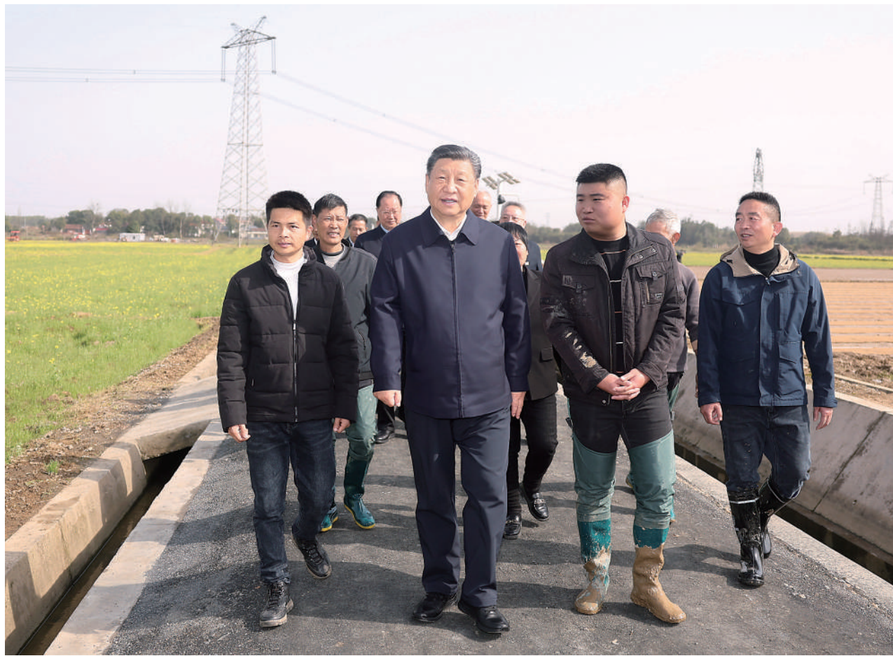
3月18日至21日，中共中央总书记、国家主席、中央军委主席习近平在湖南考察。这是19日下午，习近平在常德市鼎城区谢家铺镇港中坪村，同种粮大户、农技人员、基层干部亲切交流。

新华社长沙3月21日电 中共中央总书记、国家主席、中央军委主席习近平近日在湖南考察时强调，湖南要牢牢把握自身在构建新发展格局中的战略定位，坚持稳中求进工作总基调，坚持高质量发展不动摇，坚持改革创新、求真务实，在打造国家重要先进制造业高地、具有核心竞争力的科技创新高地、内陆地区改革开放高地上持续用力，在推动中部地区崛起和长江经济带发展中奋勇争先，奋力谱写中国式现代化湖南篇章。