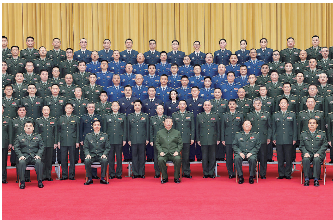
3月18日至21日，中共中央总书记、国家主席、中央军委主席习近平在湖南考察。这是20日上午，习近平在长沙亲切接见驻长沙部队上校以上领导干部，代表党中央和中央军委向驻长沙部队全体官兵致以诚挚问候。新华社记者 李刚 摄

习近平强调，湖南要更好担负起新的文化使命，在建设中华民族现代文明中展现新作为。保护好、运用好红色资源，加强革命传统和爱国主义教育，引导广大干部群众发扬优良传统，赓续红色血脉，践