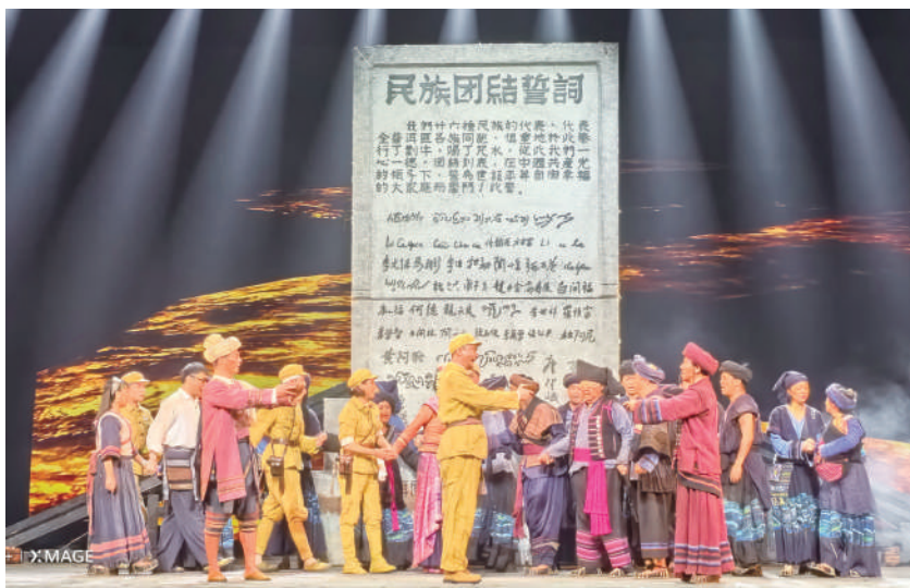
▲话剧《澜沧水长》剧照