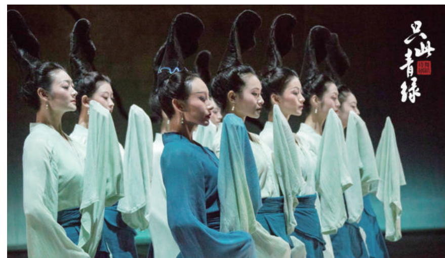
▲舞蹈诗剧《只此青绿》