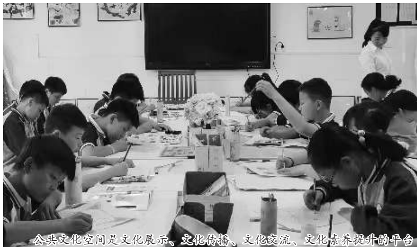
公共文化空间是文化展示、文化传播、文化交流、文化素养提升的平台