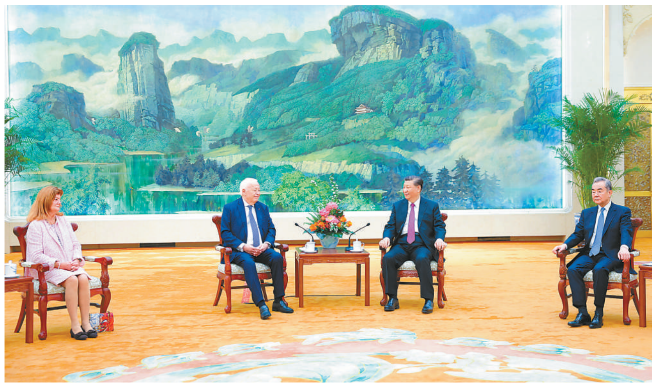
4月8日，国家主席习近平在北京人民大会堂会见法国梅里埃基金会主席梅里埃夫妇。