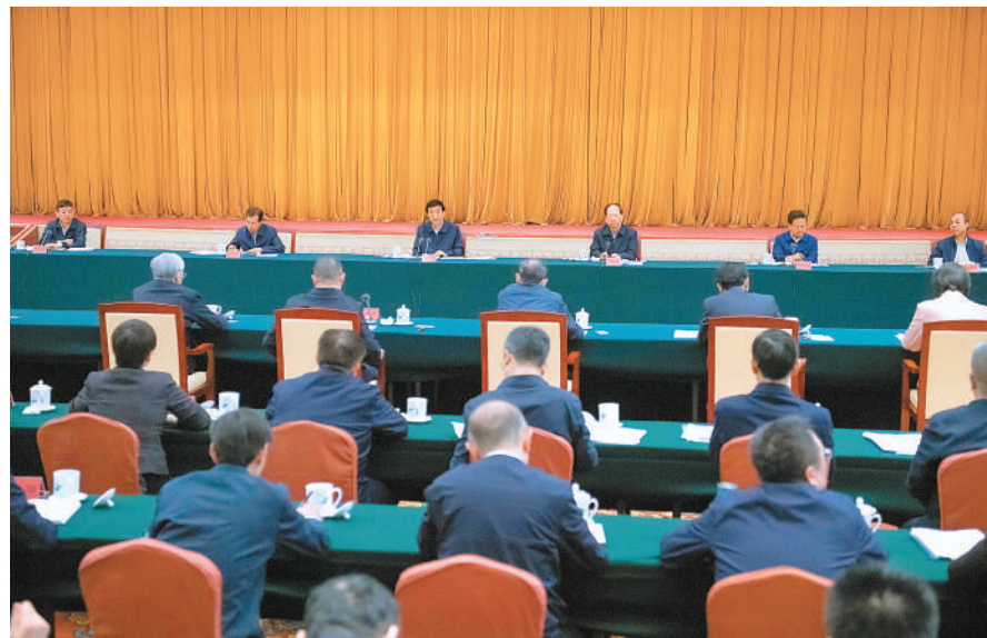
4月8日，各民主党派中央、无党派人士长江生态环境保护民主监督工作座谈会在北京召开。中共中央政治局常委、全国政协主席王沪宁出席并讲话。

新华社北京4月8日电 各民主党派中央、无党派人士长江生态环境保护民主监督工作座谈会8日在京召开。中共中央政治局常委、全国政协主席王沪宁出席并讲话。他表示，要深入学习贯彻习近平生态文明思想和全国生态环境保护大会精神，学深悟透习近平总书记关于加强长江生态环境保护的重要论述，深