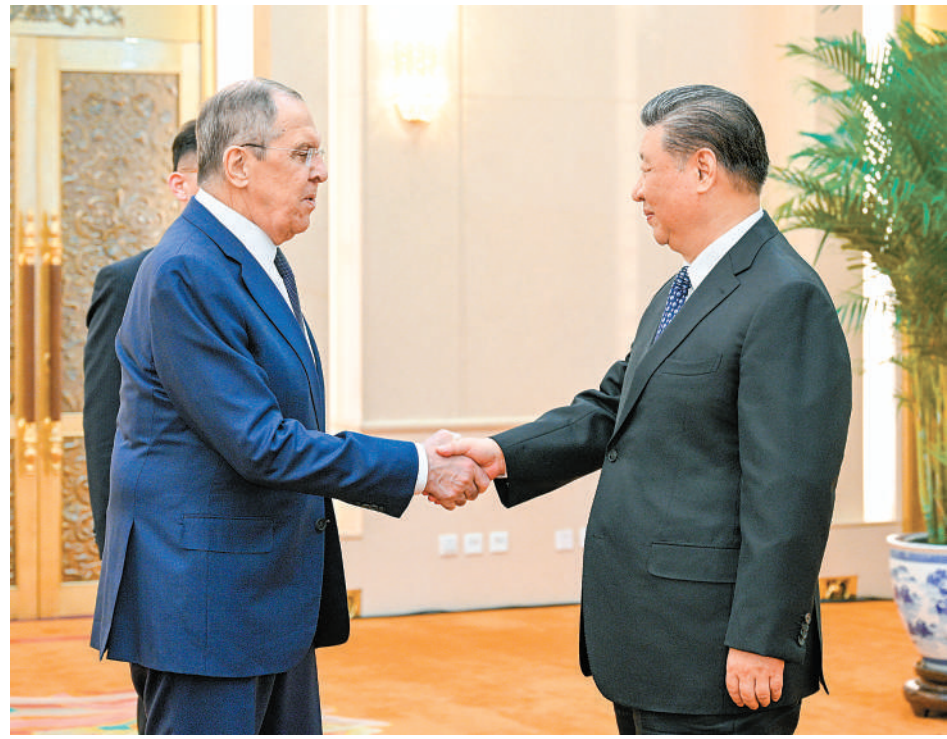
4月9日下午，国家主席习近平在北京人民大会堂会见俄罗斯外长拉夫罗夫。