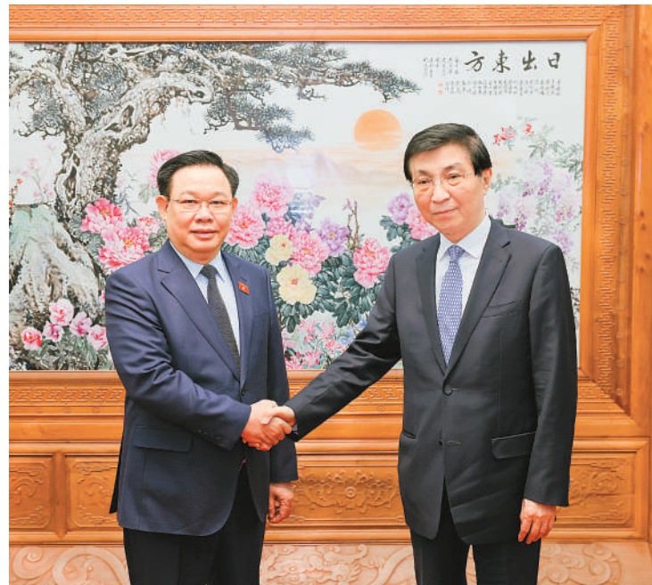
新华社北京4月9日电 全国政协主席王沪宁9日在京会见越南国会主席王庭惠。

王沪宁表示，去年12月，习近平总书记、国家主席同阮富仲总书记共同宣布构建具有战略意义的中越命运共同体，确立了新时代两国关系新定位。中方愿同越方一道，全力落实两国最高领导人共识，推进中越命运共同体建设。中国全国政协愿同越南祖国阵线中央委员会为两国关系发展作出贡献。