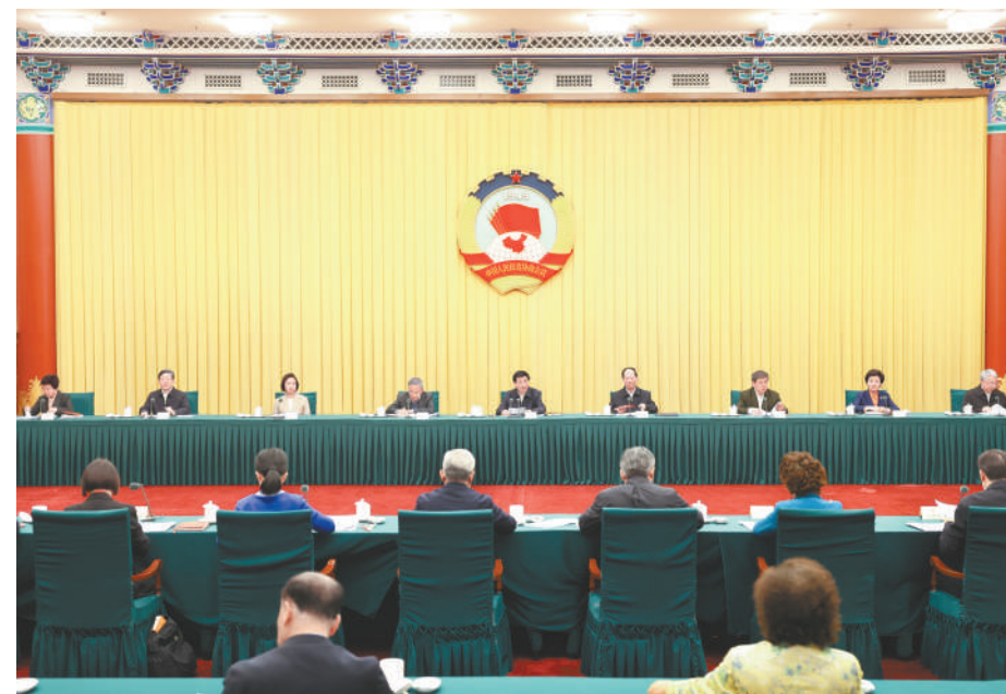
4月12日，十四届全国政协第十七次双周协商座谈会在北京召开，中共中央政治局常委、全国政协主席王沪宁主持会议。

本报讯（记者 吕巍）十四届全国政协第十七次双周协商座谈会12日在京召开，中共中央政治局常委、全国政协主席王沪宁主持会议。他表示，中共十八大以来，以习近平同志为核心的中共中央始终把解决好十几亿人口的吃饭问题作为治国理政的头等大事，加快推进农业农村现代化，实施国家粮食安全战略，坚持藏粮于地、藏粮