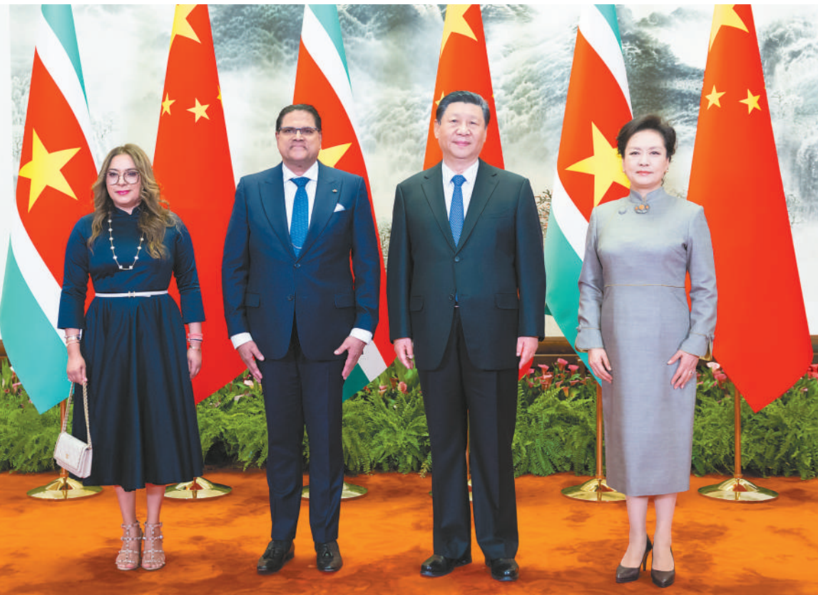
四月十二日下午，国家主席习近平在北京人民大会堂同来华进行国事访问的苏里南总统单多吉举行会谈。这是会谈前，习近平和夫人彭丽媛同单多吉和夫人梅莉萨合影。