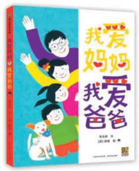
《我爱妈妈，我爱爸爸》