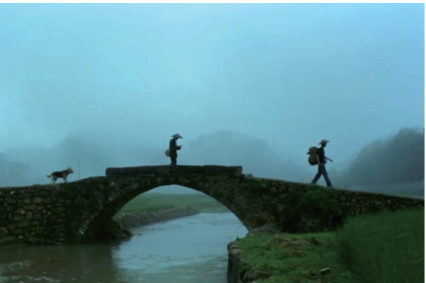
▲电影《那山 那人 那狗》剧照