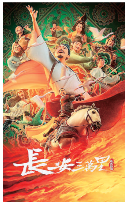
▲电影《长安三万里》海报

在霍建起看来,影视艺术的发展不仅要追求卓越的视觉效果,更要深入挖掘人文内涵。人文内涵是影视作品的灵魂,它承载着文化、历史、价值观等多方面的信息,能够引发观众的共鸣,提升作品的艺术价值和审美价值。霍建起导演的《那山 那人 那狗》《秋之白华》等,给观众留下了难忘的记忆——电影中那连绵青山、小桥流水,一