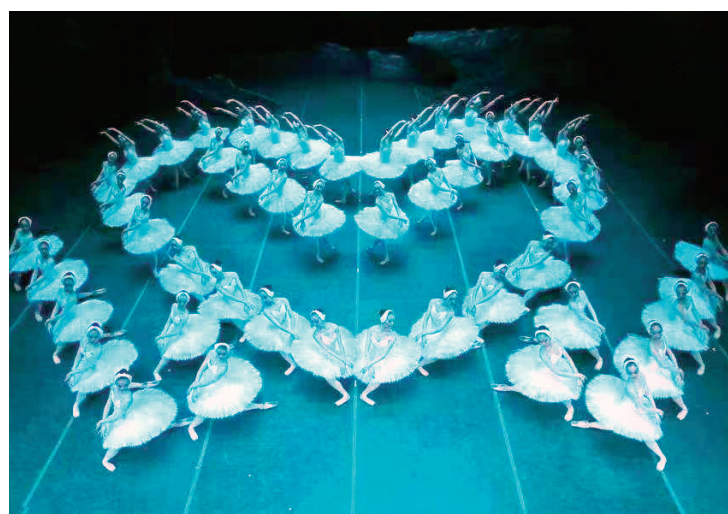
▲上海芭蕾舞团经典版《天鹅湖》剧照

习近平总书记指出,着力加强国际传播能力建设、促进文明交流互鉴。我们要深入学习贯彻习近平文化思想,坚守中华文化立场,提炼展示中华文明的精神标识和文化精髓,加快构建中国话语和中国叙事体系,在国际舞台上讲好中国故事、传播好中国声音,展现可信、可爱、可敬的中国形象。近年来,上海芭蕾舞团始终坚持以人民为中心的创作导向,以高水准的作品、高水准的呈现不断提升海派芭蕾国际影响力。一方面坚持用世界语言讲好中国故事,打造了《花样年华》《马可·波罗——最后的使命》《长恨歌》《闪闪的红星》等芭蕾语汇讲述中国故事的优秀作品,另一方面,不断探索世界经典的中国演绎。2023年5月,上海芭蕾舞团原创芭蕾舞剧《歌剧魅影》世界首演,成为首部以芭蕾语汇演绎这部经典的舞台作品。我们积极服务国家文化战略,通过海外巡演提升中国芭蕾的世界影响力。经典版《天鹅湖》于2023年8月底至10月初赴荷兰巡演,以107人的演出大团之姿圆满完成阿姆斯特丹、鹿特丹等4座城市36场演出,这也是该剧自2015年首演以来第四次赴欧洲巡演,来自德国、比利时以及荷兰当地近7万名观众走进剧场,感受到来自中国上海“天鹄海洋”所带来的震撼。2月,上芭《天鹅湖》剧组还登上了央视春晚演出的舞台,为全国亿万观众呈现了海派芭蕾的艺术风范。未来,我们将继续发挥好文艺在中外文化交流上的强大优势,用情用力讲好中国故事、传播中国文化、彰显中国精神,让中华艺术之花绽放在世界的舞台,不断推动中华文化更好地走向世界。