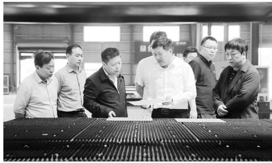
近日，安徽省亳州市政协与蒙城县政协联动，深入蒙城多家工业企业，了解企业生产经营、新产品开发、新技术应用等方面情况，并就存在问题提出意见建议，为促进企业健康发展建言献策。