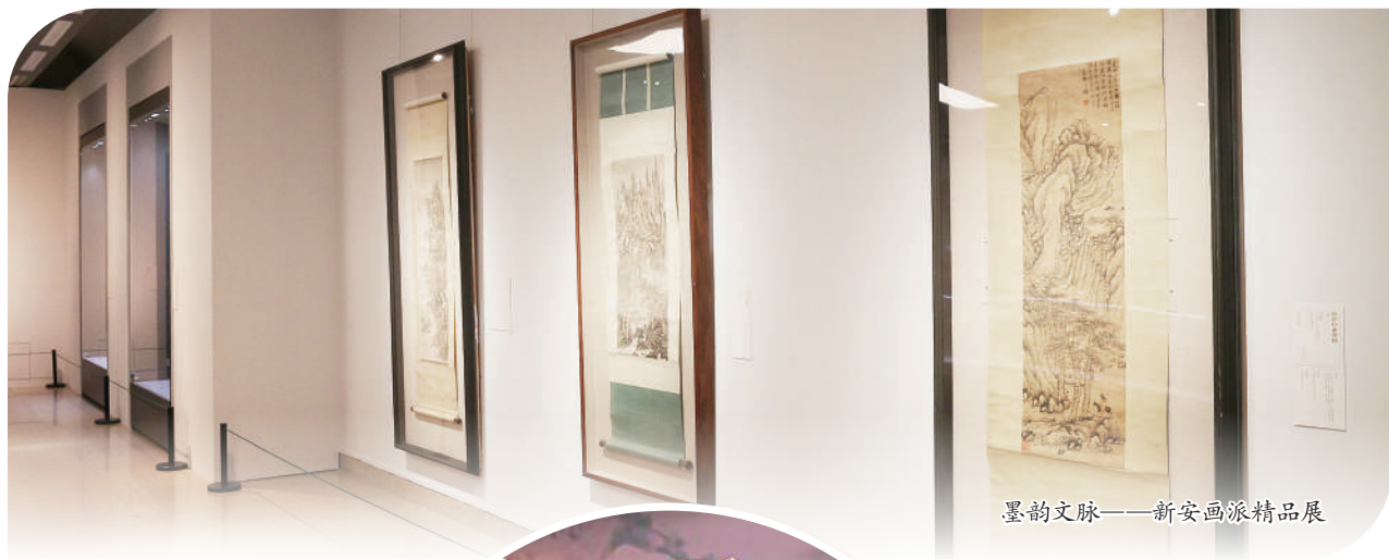
墨韵文脉——新安画派精品展

中华优秀传统文化，是中华民族之根和魂。文脉赓续，薪火相传，中华优秀传统文化在时代发展中焕发无限活力。文化传承发展是文化艺术领域政协委员本职工作和履职的着力点，凝聚着他们的不懈探索和真知灼见。本版推出“委员眼中的文化中国”系列报道，跟随政协委员的视角感受文化传承发展的生动图景和文化中国的大美气象。首期走进中国美术馆，听全国政协常委、民盟中央副主席、中国美术馆馆长吴为山讲述墨韵文脉传承的艺术魅力与美学精神。