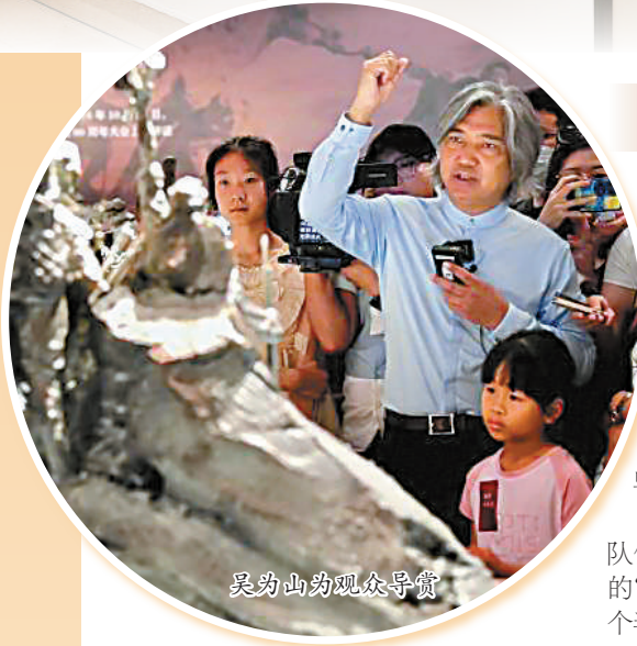
吴为山为观众导览

更不可能理解未来中国。’美的创造也是连续的，我们对美的认识要看到它的连续性。”在吴为山看来，博物馆浓缩了历史的精华，中华文化薪火相传，留下灿烂丰厚的文化遗产，从中可以充分感受到中华文化的基因，这也是我们得以不断创新发展的根脉；美术馆紧扣时代脉搏，涵养心灵的美术、美感和美育，以视觉形式反映现实，彰显精神境界。博物馆与美术馆都是中华文明的保存者和记录者，呈现出中华文脉传承的轨迹，因此，携手合作、相互补充、相得益彰是体现中华文明突出的连续性的必要，也是必然。