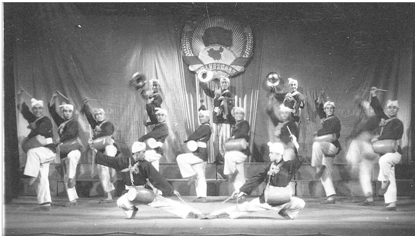
▲大歌舞《人民胜利万岁》之《庆祝胜利》剧照 香山革命纪念馆藏