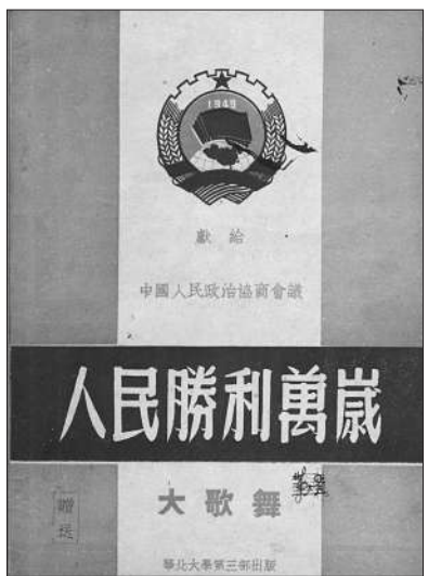
▲华北大第三部出版的《人民胜利万岁》大歌舞节目册封面 香山革命纪念馆藏

用，对开4页，长13.1厘米，宽19.1厘米，纸张已泛黄，第1页为幕前献词，第2至第4页为每段歌舞导演与内容说明。