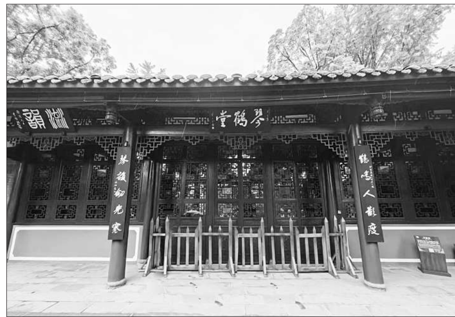
四川省崇州市区罨画池公园内琴鹤堂