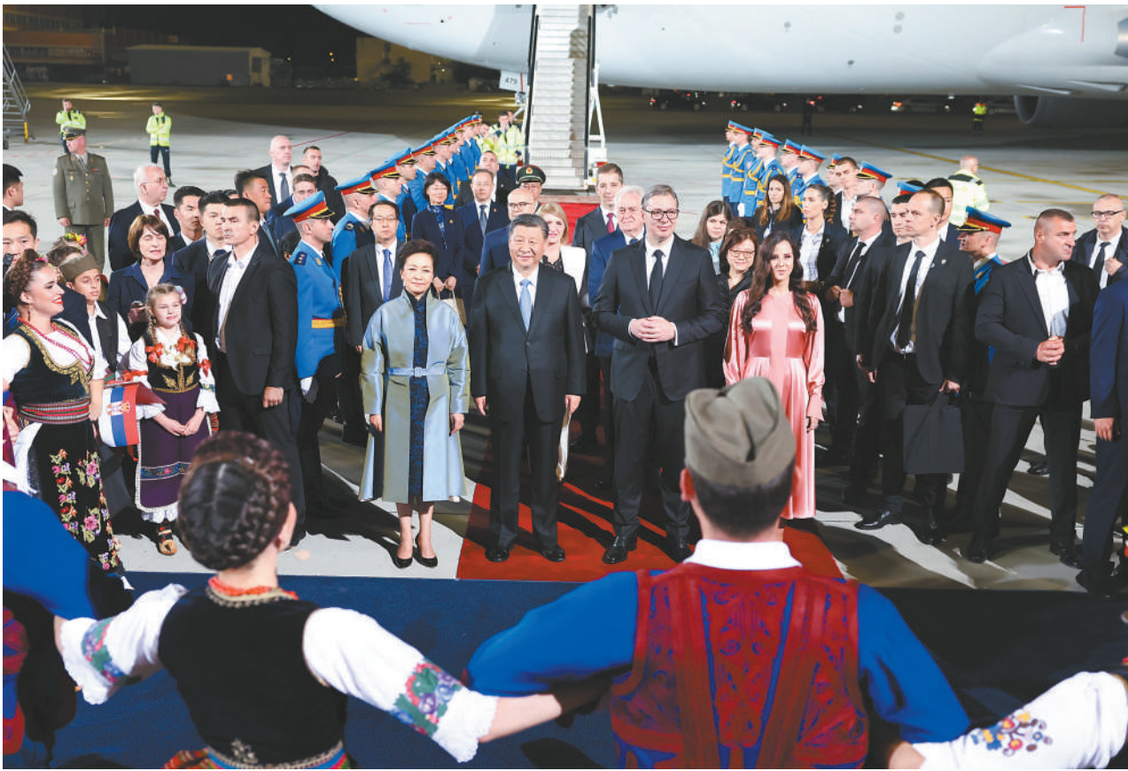
当地时间5月7日晚,国家主席习近平乘专机抵达贝尔格莱德,应塞尔维亚总统武契奇邀请,对塞尔维亚进行国事访问。习近平乘坐专机抵达贝尔格莱德尼古拉·特斯拉国际机场时,塞尔维亚总统武契奇夫妇,对华合作国家委员会主席、前总统尼科利奇夫妇,议长布尔纳比奇,总理武切维奇和外长久里奇等热情迎接。