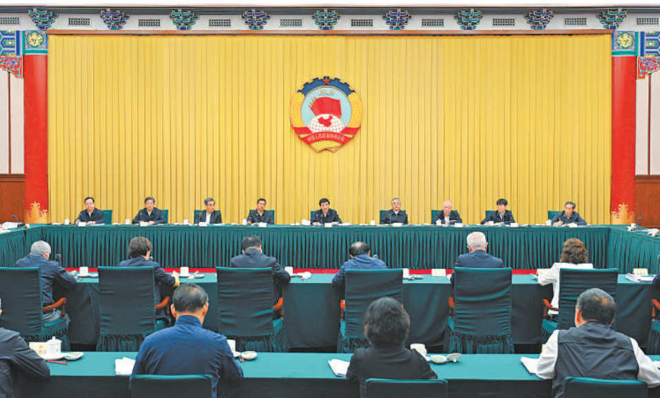
5月10日，十四届全国政协第十八次双周协商座谈会在北京召开，中共中央政治局常委、全国政协主席王沪宁主持会议。

本报讯（记者 刘彤）十四届全国政协第十八次双周协商座谈会5月10日在京召开，中共中央政治局常委、全国政协主席王沪宁主持会议。他表示，建设自由贸易试验区是以习近平同志为核心的中共中央在新时代推进改革开放的重要战略举措，实施自由贸易试验区提升战略是适应新征程新形势新