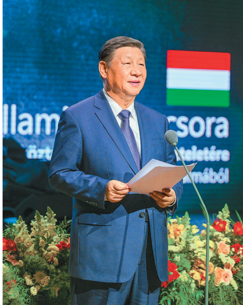
当地时间五月九日晚，国家主席习近平和夫人彭丽媛在布达佩斯城堡山出席匈牙利总理欧尔班和夫人雷沃伊举行的隆重欢迎宴会。这是习近平在宴会上致辞。

我们都认为，共建“一带一路”倡议同匈方“向东开放”战略高度契合。双方将加强发展战略对接，深化经贸、投资、金融等领域合作，推进匈塞铁路等重点项目建设，拓展新兴产业合作，培育新质生产力，为两国各自经济社会发展赋能助力。 我们都认为，中匈传统友谊有深厚基础。双方将继续支持两国语言教学，用好互设的文化中心平台，加强体育、媒体、地方等领域交流合作，促进文明互鉴、民心相通。双方将进一步优化各自出入境政策，加强两国直航联系，为扩大双向人员往来创造更多有利条件。 （下转2版）