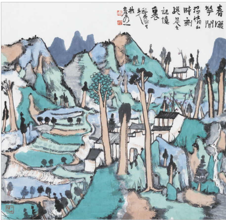
春暖花开(国画) 林容生 作