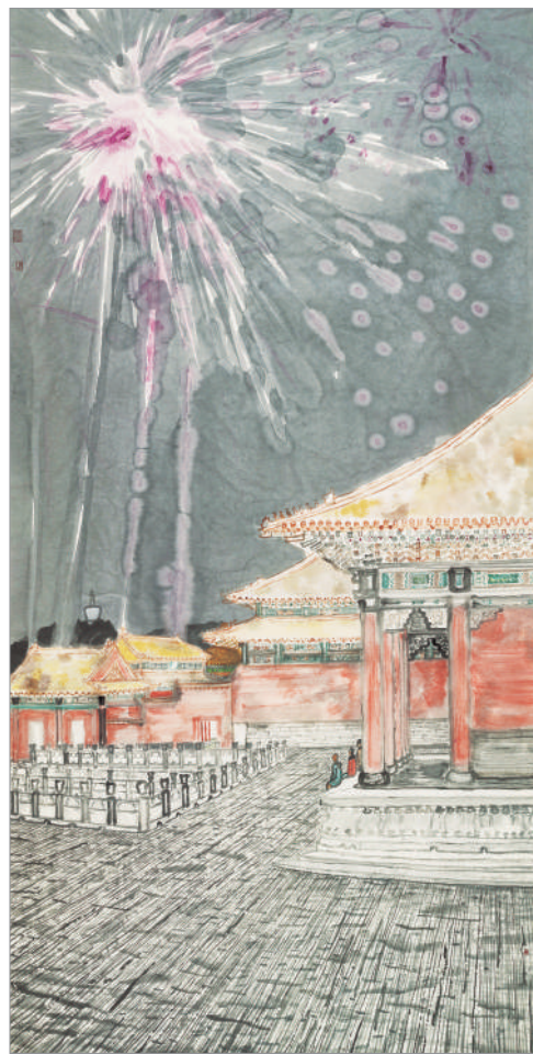
正月(国画) 方向 作