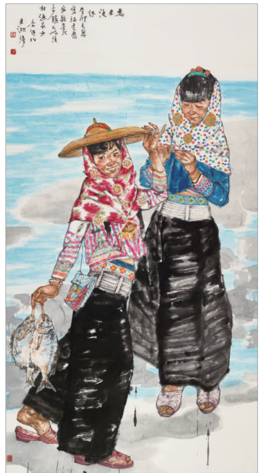
惠东渔讯(国画) 李洋 作