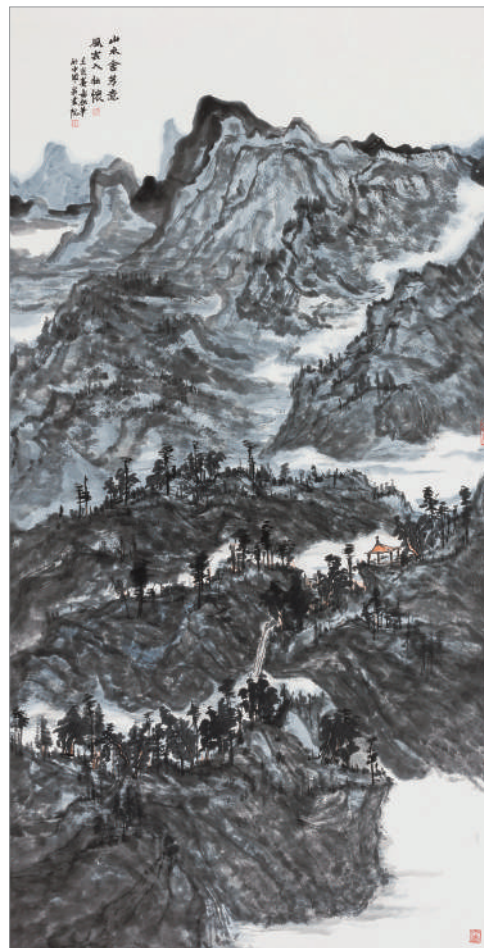
山水含芳意(国画) 董雷 作