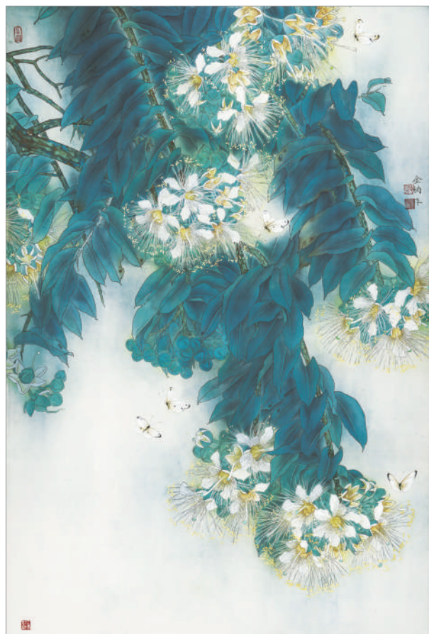
晨曲(国画) 金纳 作