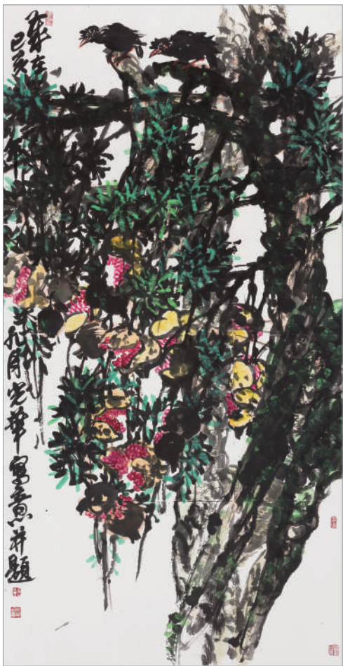
秋实图(国画) 于光华 作