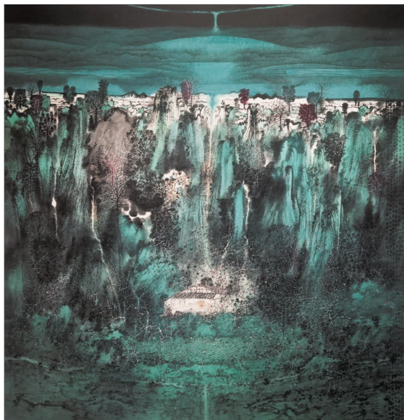
精神家园(国画) 卢高舜 作