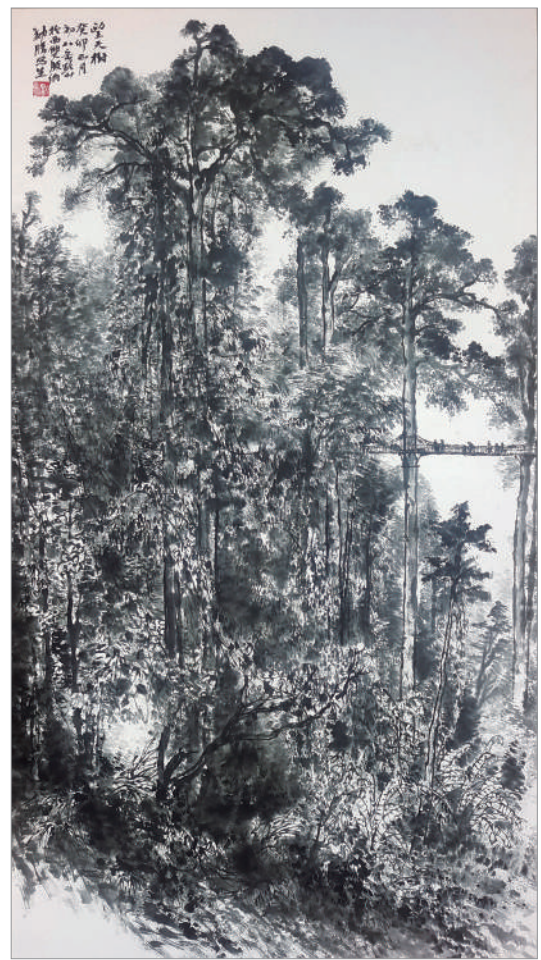
望天树(国画) 岳黔山 作