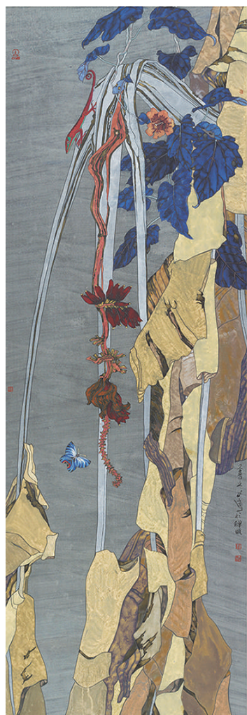
热带写生(国画) 郭子良 作