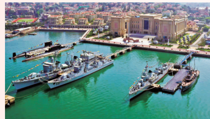
◀青岛海军博物馆由中国人民解放军海军创建,是中国唯一的一座全面反映中国海军发展的军事博物馆。