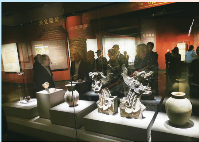
黑龙江省哈尔滨市金上京历史博物馆是中国唯一一座展示金代历史,弘扬金源文化的专题博物馆。