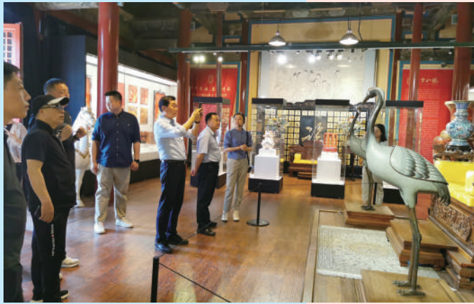
观众在燕京八绝博物馆参观。