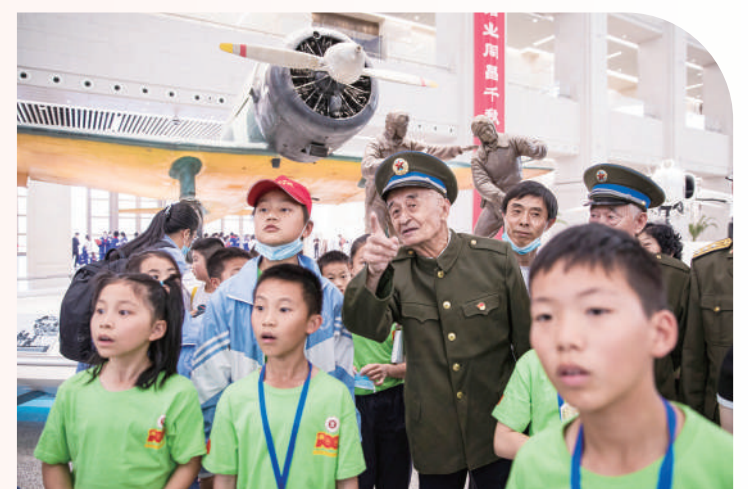
中国人民革命军事博物馆是中国唯一的大型综合性军事历史博物馆,是教育部第一批全国中小学生研学实践教育基地。