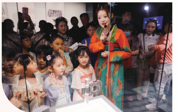
随着近年来“博物馆热”的持续升温,河南博物院夜间开放,拓展服务方式,弘扬中华优秀传统文化。