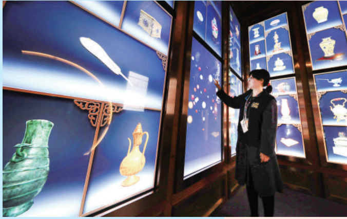
在北京故宫端门数字馆举办的主题数字体验展上,观众被文物精品制作的数字模型吸引。