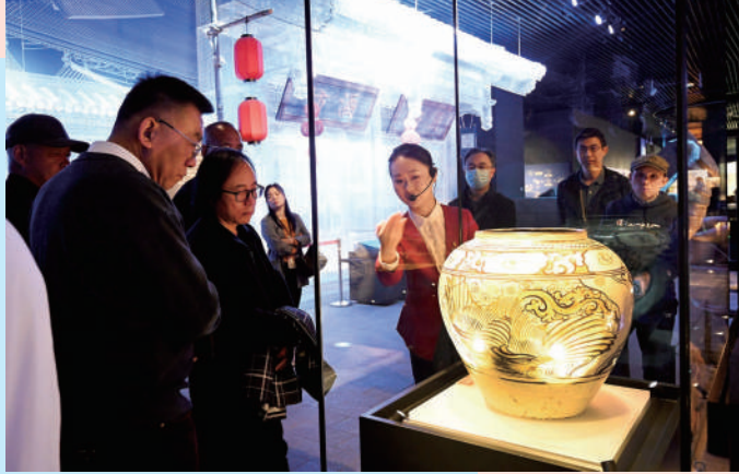
北京大运河博物馆(首博东馆),首都文化新地标之一北京大运河博物馆致力于活态展现运河文化。