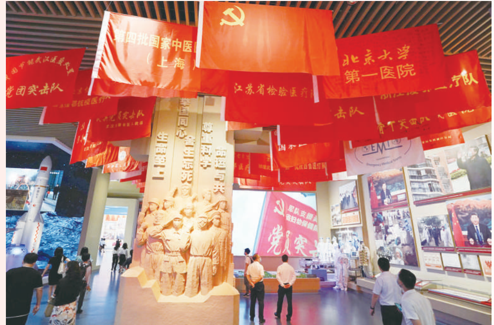
▲中国共产党历史展览馆史诗般展现中国共产党波澜壮阔的百年历程。本报记者 贾宁 摄