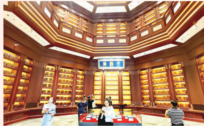
◀中国国家版本馆,是保藏、展示国家版本资源的场馆。