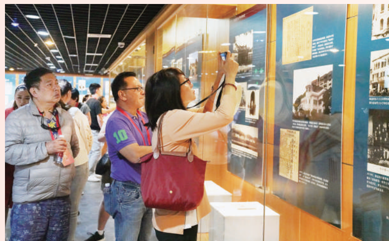
位于福建省厦门市华侨博物院是中国第一家全面系统收集、研究、展示华侨华人历史和业绩的博物馆。