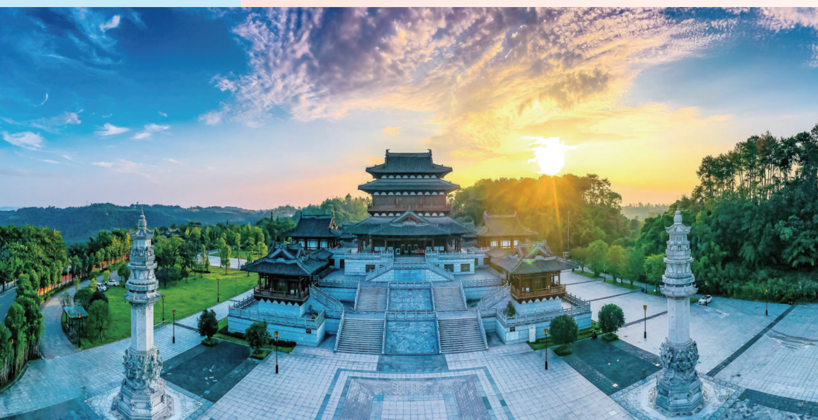
被列入世界遗产名录的重庆大足石刻是中国古代石窟艺术巅峰之作。大足石刻博物馆是目前我国规模最大的石窟寺专业博物馆,其石窟寺遗存被列为各级文物保护单位七十多处,造像五万余尊,铭文十万余字。该馆集陈列展示、保护、收藏及服务于一体,充分采用数字化等现代科技手段生动展示石刻历史文化价值,增强游客沉浸式参观体验感。