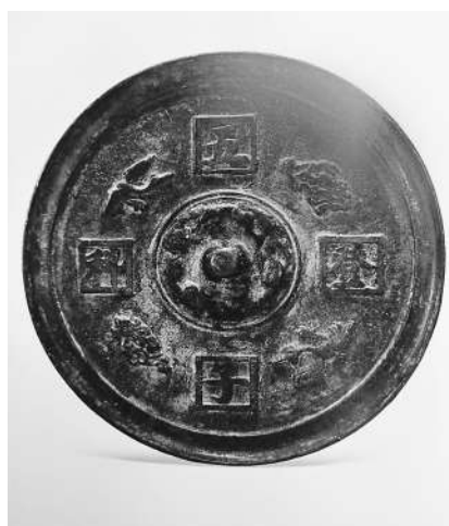
明“五子登科”铭文镜

武汉博物馆收藏有一枚明代“五子登科”铜镜，直径18厘米。圆形，圆钮，素缘。镜钮区处于一周弦纹内，沿镜钮有一圈柱状纹，有应考得中的“折桂”寓意。外区处于内外弦纹之间，呈对称形式分布有四个凸起的方框，框内分别楷书一字，组合起来就是“五子登科”四字，“五”“子”上下对称，“登”“科”左右相对，字体端庄厚实，遒劲而又不乏秀美。方框之间，分别以双雁和两朵牡丹花隔开，呈上下、左右对称分布，大雁呈飞翔状，牡丹枝叶繁茂，花朵盛开，有功名富贵寓意。整件器物除了局部有锈蚀，基本上保存完好，包浆