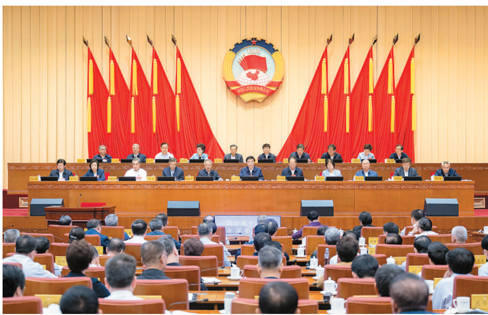
6月6日上午，政协第十四届全国委员会常务委员会第七次会议在北京闭幕，会议以“构建高水平社会主义市场经济体制”为议题协商议政。中共中央政治局常委、全国政协主席王沪宁主持闭幕会并讲话。