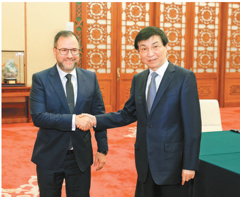
6月7日，全国政协主席王沪宁在北京会见委内瑞拉外长希尔。

新华社北京6月7日电 全国政协主席王沪宁7日在京会见委内瑞拉外长希尔。 王沪宁表示，去年9月，习近平主席和玛杜罗总统共同宣布将中委关系提升为全天候战略合作伙伴关系，引领两国关系进入新的历史时期。中方愿同委方一道，以中委建交50周年为新起点，把两国元首重要共识转化为赓续中委友好的实际行动，共同开辟中委关系更加美好的下一个50年。中国全国政协愿为中委合作营造良好环境，汇聚更多正能量。