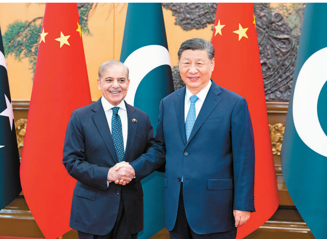
6月7日下午，国家主席习近平在北京人民大会堂会见来华正式访问的巴基斯坦总理夏巴兹。