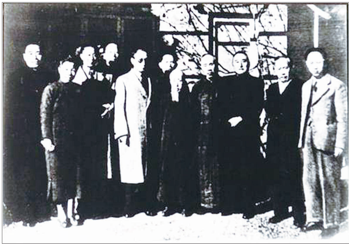
▲“旧政协”会议部分代表合影

中共代表团还是以人民利益为重，拿出最大诚意，全身心地投入到政治协商工作中，团结多数中间党派和社会政治团体，与国民党的错误主张进行了有理、有利、有节的斗争，并与各民主党派结下了深厚的友谊。