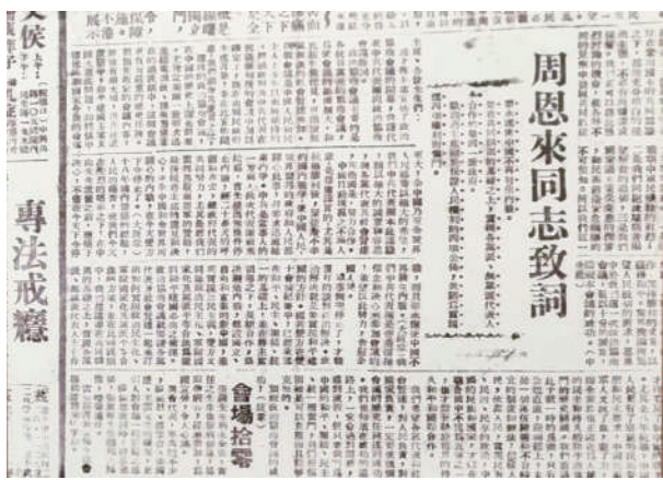
▲《新华日报》刊登周恩来在旧政协会议上的致辞

在1月14日的会议上，周恩来发言说：“蒋主席在会中宣布的四项主张，其中第四项是释放政治犯，我们非常拥护，全国人民迫切希望全部实现。有些事情当然要有步骤，但放人这件事可以立即做。”周恩来说：“在刚才的霎那间，我突然想起一个人来，没有他，就不可能促成我们民族惊天动地的团结抗战，也就不会有民族复兴节那天的欢欣情景。这个人就是张汉卿先生，可这位于民族有功的人，至今仍然被禁闭着没有自由，这是不合情理的，因此我吁请蒋主席尽早释放汉卿先生。”周恩来的一番话出人预料、语惊四座，会场一阵沉默。