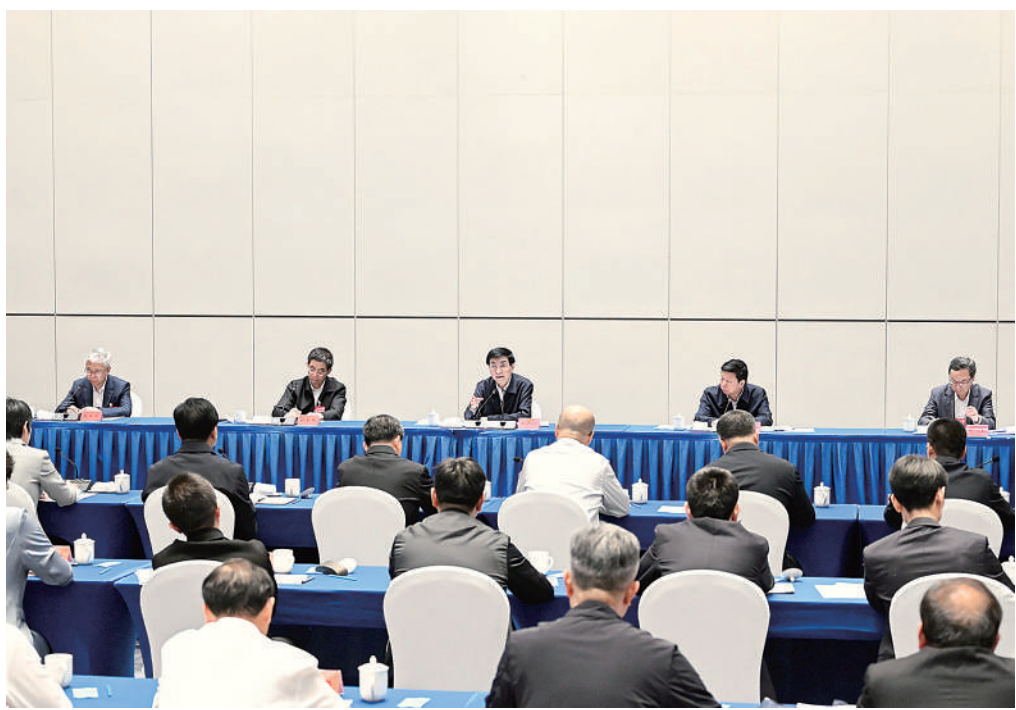
6月14日,两岸融合发展示范区建设专题推进会在福建厦门召开。中共中央政治局常委、全国政协主席王沪宁出席并讲话。新华社记者 申宏 摄

不断突破。要促进两岸经济文化交流合作,深化两岸各领域融合发展,让台湾同胞分享中国式现代化发展机遇、共享祖国大陆发展进步成果。