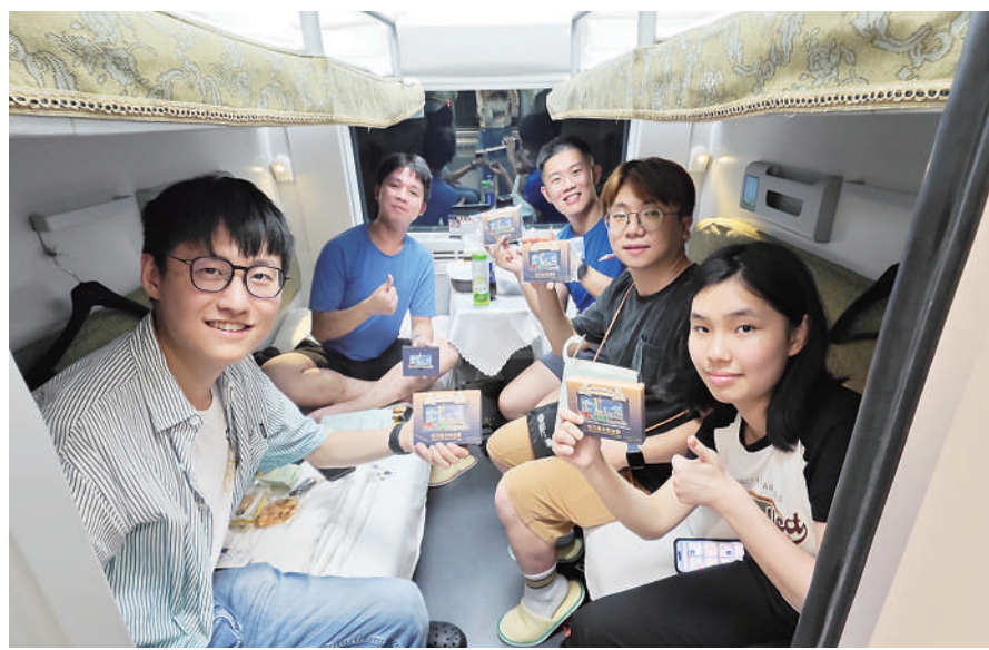
6月15日，乘客在香港西九龙至上海虹桥D908次高铁动卧列车上展示收到的首班车票纪念品。

“加开京港、沪港高铁动卧进一步满足了广大旅客对跨境出行的需求，为香港与内地经贸商务人士往来提供交通出行的新选择，让香港与内地居民探亲旅游更便利。”全国政协委员、中国旅游集团董事长陈寅表示，香港与内地相关城市政府应支持和鼓励旅游业界抓住跨境旅客运输的有利条件，面向商务、亲子及中老年等客群，丰富和升级旅游供给，推动香港旅游市场转型升级，同时围绕建设中外文化艺术交流中心，深化文旅融合，举办更多国内国际大型活动和高水平文体赛事，擦亮香港国际大都会和“美食之都”“艺术之都”“会展之都”的名片。“内地也要为香港居民北上旅游增加丰富的旅游产品、优质便利的服务和中华文化特色的场景项目，让香港居民在饱览祖国大好河山时更多