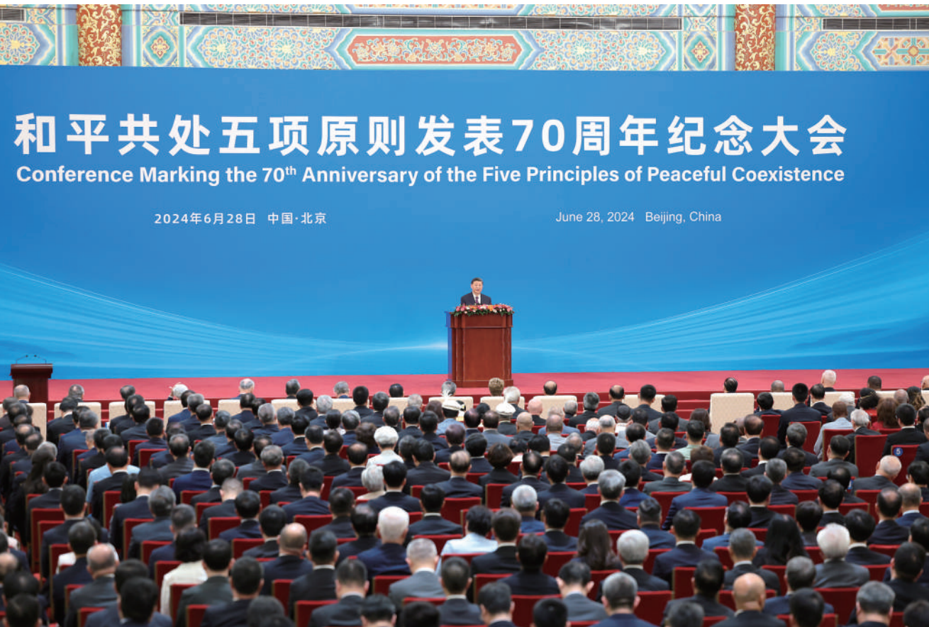
6月28日上午，和平共处五项原则发表70周年纪念大会在北京人民大会堂隆重举行。国家主席习近平出席纪念大会并发表题为《弘扬和平共处五项原则，携手构建人类命运共同体》的重要讲话。

新华社北京6月28日电（记者 孙奕 马卓言）6月28日上午，和平共处五项原则发表70周年纪念大会在北京人民大会堂隆重举行。国家主席习近平出席纪念大会并发表题为《弘扬和平共处五项原则，携手构建人类命运共同体》的重要讲话。 仲夏时节，天高云淡。人民大会堂金色大厅，庄严辉煌，高朋满座。 上午十时，在恢弘的《和平—命运共同体》乐曲声中，习近平步入金色大厅。 习近平同出席纪念大会的各国政要一一握手，亲切互动。 在热烈的掌声中，习近平发表重要讲话。 习近平指出，在近现代人类社会发展的历史进程中，处理国与国关系，共同维护世界和平与安宁，促进全人类发展与进步，始终是各国不懈探索的重大命题。70年前，民族独立和解放运动风起云涌，世界殖民体系土崩瓦解。冷战阴云笼罩世界，“强权即公理”甚嚣尘上，刚刚获得独立的新生国家渴望维护国家主权、发展民族经济。中国领导