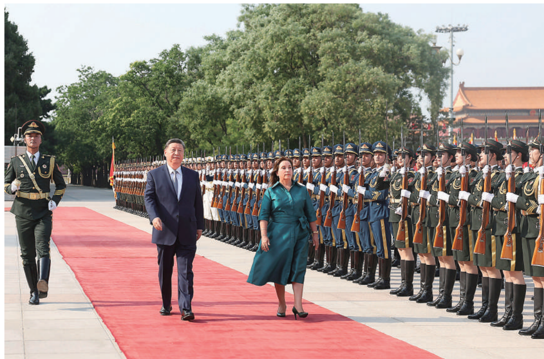
六月二十八日下午，国家主席习近平在北京人民大会堂同来华进行国事访问的秘鲁总统博鲁阿尔特举行会谈。这是会谈前，习近平在人民大会堂东门外广场为博鲁阿尔特举行欢迎仪式。

新华社北京6月28日电（记者 孙奕）6月28日下午，国家主席习近平在北京人民大会堂同来华进行国事访问的秘鲁总统博鲁阿尔特举行会谈。 习近平指出，中国和秘鲁都是文明古国，两国友谊源远流长，人民友好深入人心。秘鲁是最早同新中国建交、最早同中国建立全面战略伙伴关系的拉美国家之一，也是最早同中国签署一揽子自由贸易协定的拉美国家。近年来，在双方共同努力下，中秘各领域合作取得丰硕成果，中国企业