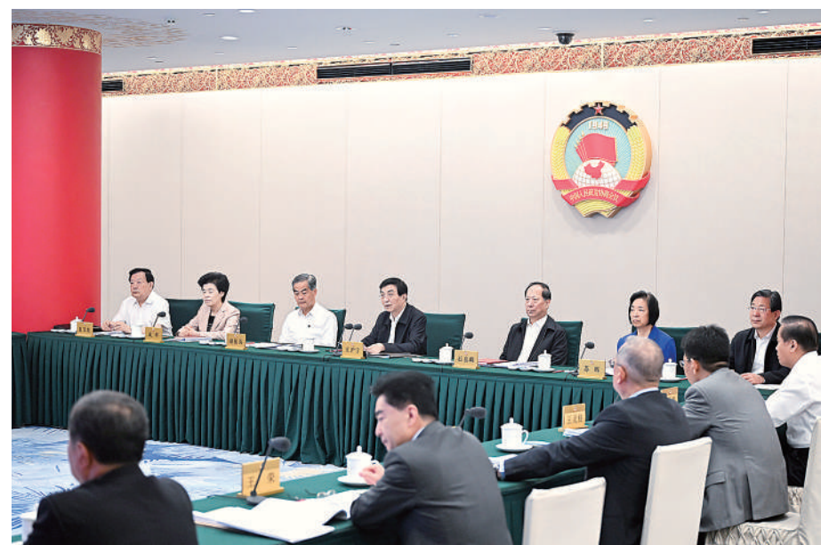
6月28日，全国政协在北京召开远程协商会，中共中央政治局常委、全国政协主席王沪宁主持会议。

本报讯（记者 吕巍）全国政协28日在京召开远程协商会，中共中央政治局常委、全国政协主席王沪宁主持会议。他表示，中共十八大以来，习近平总书记高度重视发挥港澳在国家对外开放大局中的作用，亲自谋划、部署、推动实施粤港澳大湾区重大战略，推动港澳更好融入国家发展大局，引领港澳在服务构建新发展格局、共建“一带一路”、粤港澳大湾区建设等方面发挥更大作用。人民政协要认真学习贯彻习近平总书记关于港澳工作的重要论述和中共中央决策部署，把履履职建言方向和着力点。 王沪宁表示，要聚焦发挥港澳在我国建设更高水平开放型经济新体制中的作用等相关重点问题持续深化研究，提出针对性、操作性强的对策建议，紧扣落实国家支持港澳发展政策举措提供助力。（下转4版）