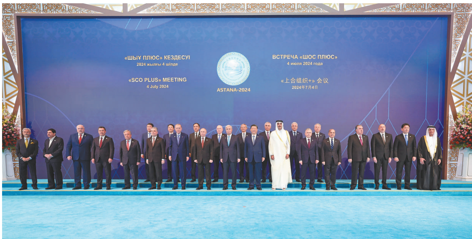
当地时间7月4日下午,国家主席习近平在阿斯塔纳出席“上海合作组织+”阿斯塔纳峰会并发表题为《携手构建更加美好的上海合作组织家园》的重要讲话。峰会开始前,习近平出席托卡耶夫为与会代表团团长举行的欢迎宴会并集体合影。

新华社阿斯塔纳7月4日电(记者 孙浩 黄河 张继业)当地时间7月4日下午,国家主席习近平在阿斯塔纳出席“上海合作组织+”阿斯塔纳峰会并发表题为《携手构建更加美好的上海合作组织家园》的重要讲话。习近平指出,我们首次以“上海合作组织+”的形式举行峰会,好朋友、新伙伴济济一堂、共商大计,说明在新的时代条件下本组织理念广受欢迎,成员国的朋友遍布天下。当前,世界之变、时代之变、历史之变正以前所未有的方式展开。人类文明在大步前进的同时,不安全、不稳定、不确定因素也明显增加。应对好这一变局,关键要有识变之