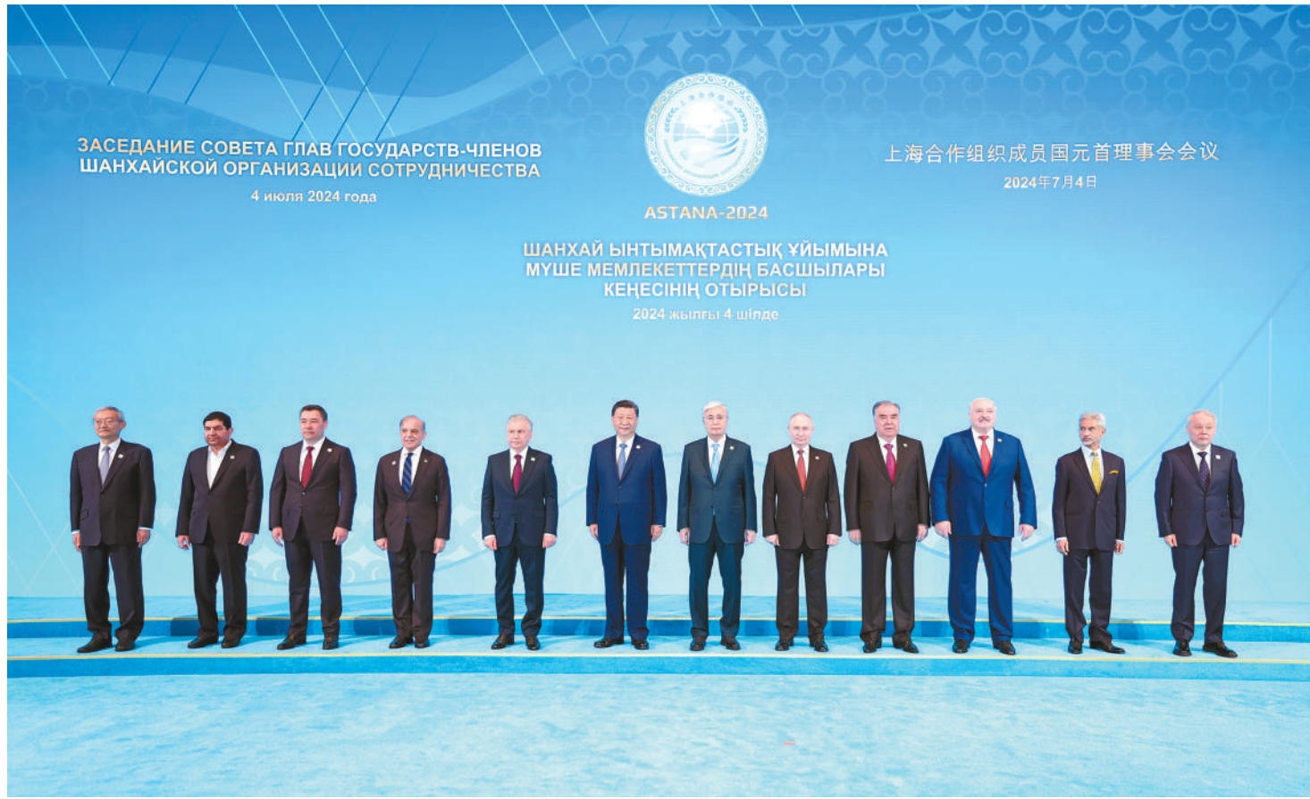
当地时间7月4日上午,国家主席习近平在阿斯塔纳独立宫出席上海合作组织成员国元首理事会第二十四次会议。这是习近平同上海合作组织成员国领导人集体合影。