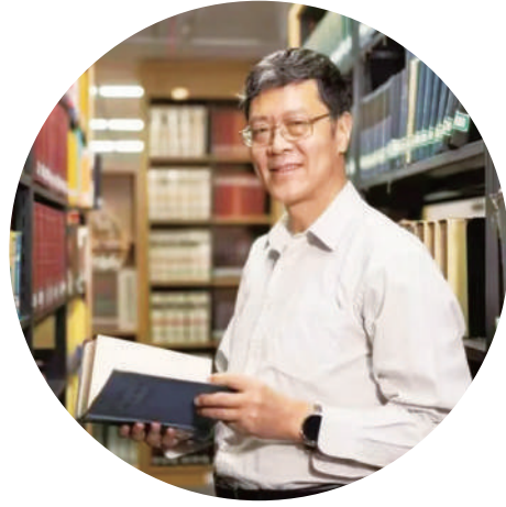
▲全国人大代表，中国社会科学院学部委员、中国边疆研究所所长邢广程