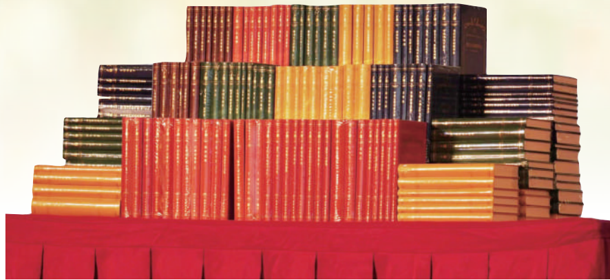
“汉译世界学术名著丛书”