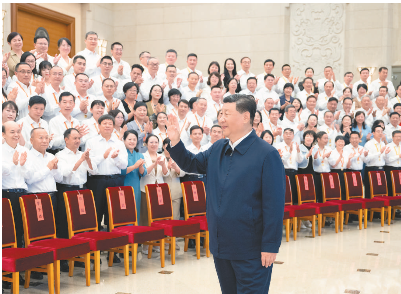
九月九日，党和国家领导人习近平、李强、蔡奇、丁薛祥等在北京接见参加庆祝第四十个教师节暨全国教育系统先进集体和先进个人表彰活动代表。

新华社北京9月10日电 全国教育大会9日至10日在北京召开。中共中央总书记、国家主席、中央军委主席习近平出席大会并发表重要讲话。他强调，建成教育强国是近代以来中华民族梦寐以求的美好愿望，是实现以中国式现代化全面推进强国建设、民族复兴伟业的先导任务、坚实基础、战略支撑，必须朝着既定目标扎实迈进。 9月10日是我国第四十个教师节。习近平代表党中央，向全国广大教师和教育工作者致以节日祝贺和诚挚问候。 李强主持会议。赵乐际、王沪宁、蔡奇、李希出席会议。丁薛祥作总结讲话。 习近平在讲话中指出，教育是强国建设、民族复兴之基。党的十八大以来，我们坚持把教育作为国之大计、党之大计，全面贯彻党的教育方针，作出深入实施科教兴国战略、加快教育现代化的重大决策，确立到2035年建成教育强国的奋斗目标，加强党对教育工作的全面领导，不断推进教育体制机制改革，推动新时代教育事业取得历史性成就、发生格局性变化，教育强国建设迈出坚实步伐。 习近平强调，我们要建成的教育强国，是中国特色社会主义教育强国，应当具有强大的思政引领力、人才竞争力、