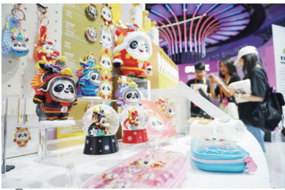
北京顺义展示区里的奥运文创产品展示