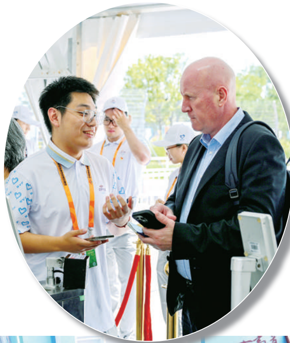
服贸会期间，共青团北京市委员会组织的来自清华大学等二十二所高校，以及首钢集团、共青团石景山区委员会的一千四百五十名志愿者为参展参会嘉宾提供暖心服务。

服贸会是全球第一个聚焦服务贸易的综合性、国际化展会平台，自2012年创办至今，累计吸引197个国家和地区的90余万展商参展参会，成为促进服务业和服务贸易合作的重要国际公共产品。