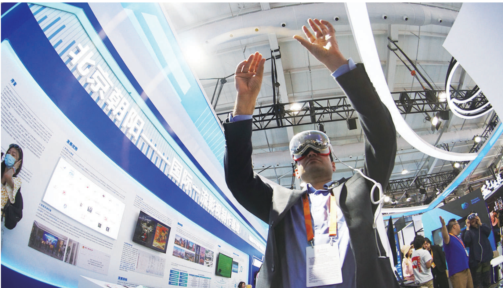
外国友人在北京朝阳展区体验VR技术装备