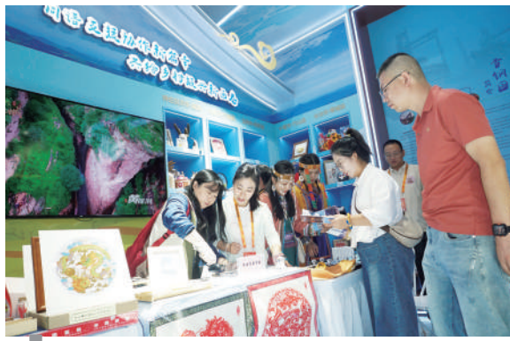
北京石景山区邀请山西黎城县、湖北竹山县、青海称多县等支援协作地区联合在现场开展文旅推介。