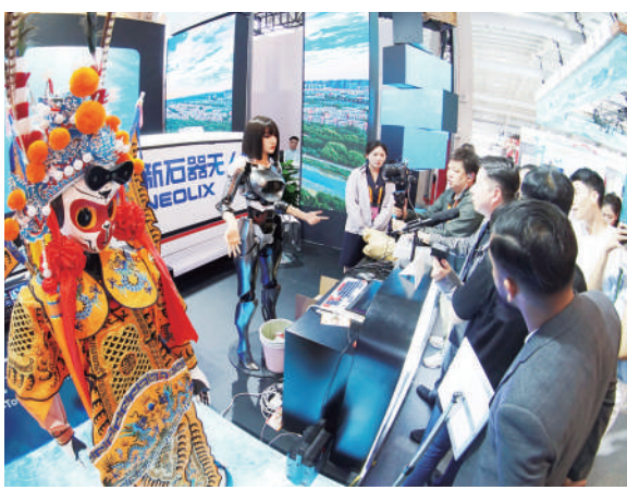
戏曲机器人和仿真机器人引发观众们浓厚的兴趣