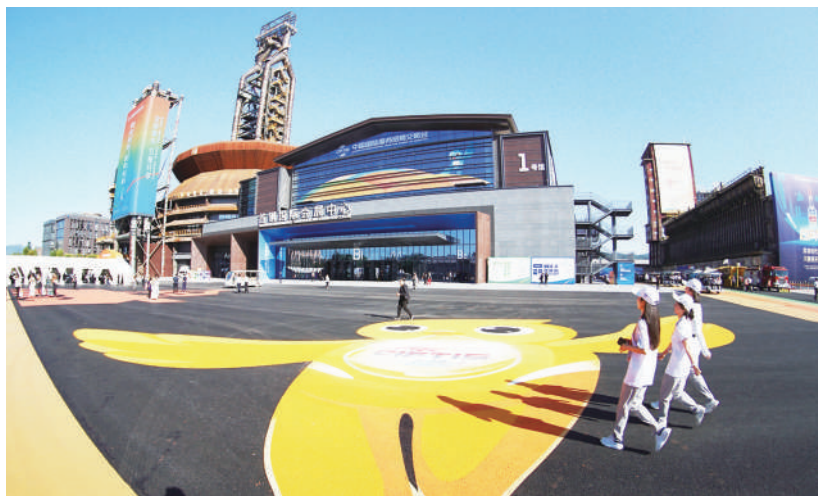
今年服贸会有一个绝不能错过的“巨无霸”首发，就是首钢园区四高炉将以首钢国际会展中心综合体的身份首次亮相。