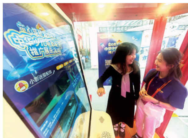
观众在中国电影博物馆展区的迷你配音厅里体验