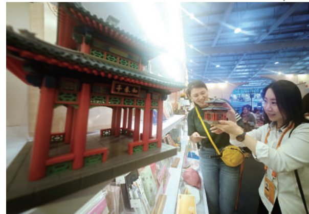
北京颐和园展区的文创产品让观众爱不释手