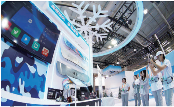
北京延庆展示区里的冬季运动器材展示