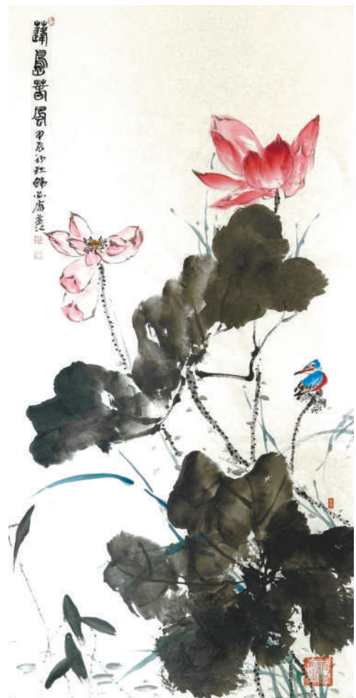
■题记：蓬岛，理想之境界；春风，万物已苏生。蓬岛春风，献给人民政协成立七十五周年。 ——韩必省