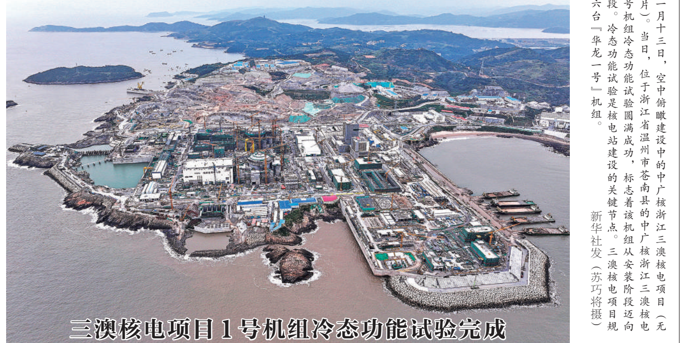
三澳核电项目1号机组冷态功能试验完成

“建立科学合理的全流域横向生态保护补偿机制，是整合各方力量共同推动‘绿水青山’向‘金山银山’转化的有效路径，也是促进高质量发展和高水平安全良性互动的重要抓手。”永定河流域是京津冀地区重要的生态涵养区，北京市政协委员、北京大学地球与空间科学学院教授鲁安怀在代表民盟市委发言时，结合相关调研成果分享了关于永定河流域生态保护的思考。(下转4版)