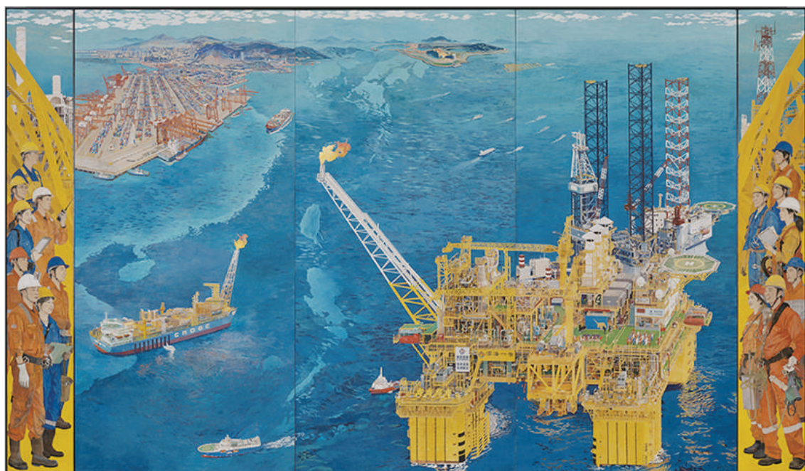
向海图强 逐梦深蓝 (壁画) 马鑫 作