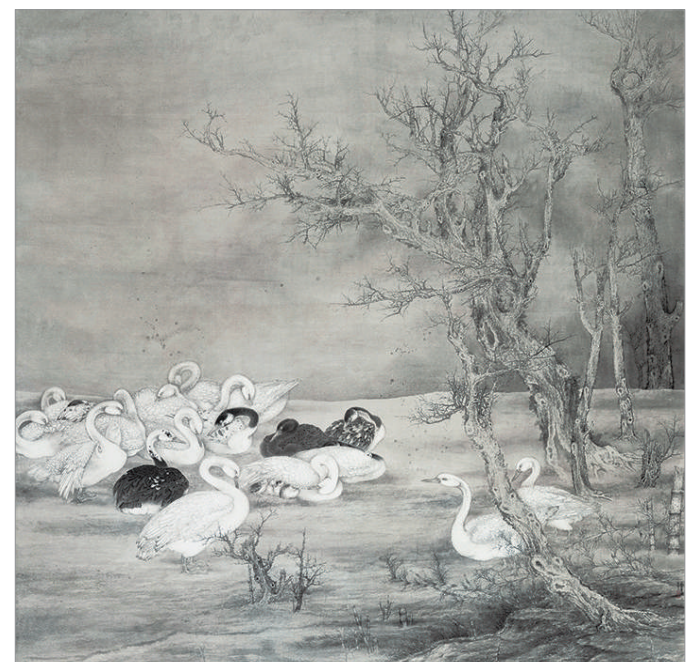
白露 (国画) 裴书鸿 作