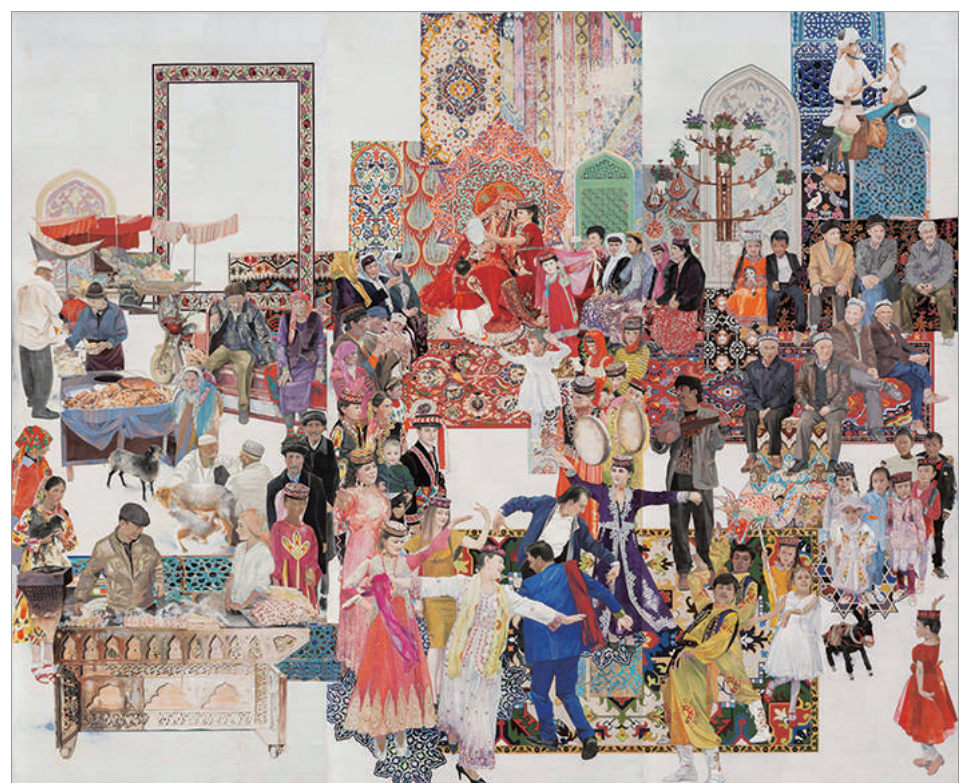
美丽新疆 (壁画) 李丹 刘梓涵 刘睿 刘丽娟 合作