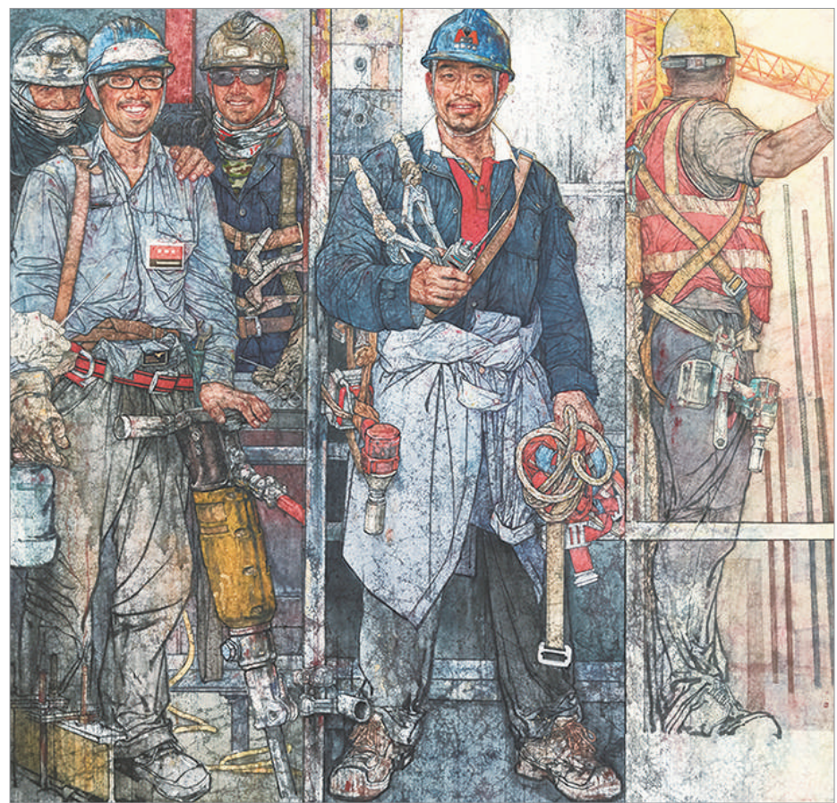
筑梦 (国画) 李玉旺 作