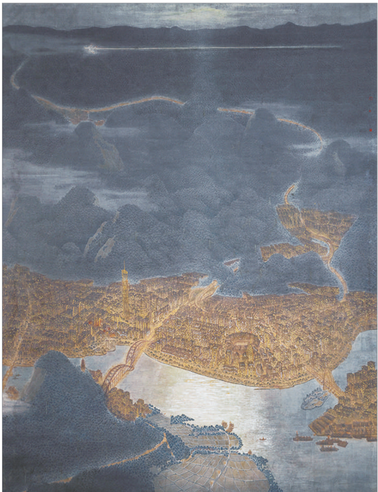
点点繁星 (国画) 冼子子 冼一凡 合作