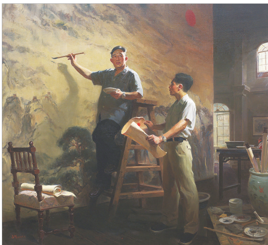
山河颂 (油画) 吕鹏 作