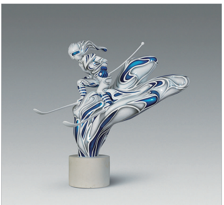
飞起玉龙三百万, 搅得周天寒彻 (雕塑) 刘政 作