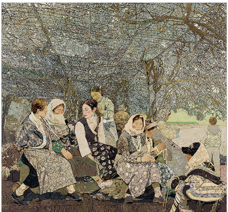
天路——国槐绿 (漆画) 陈国 作