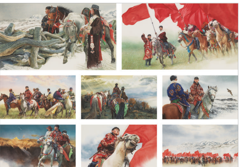
旌旗 (连环画) 沈璐 作