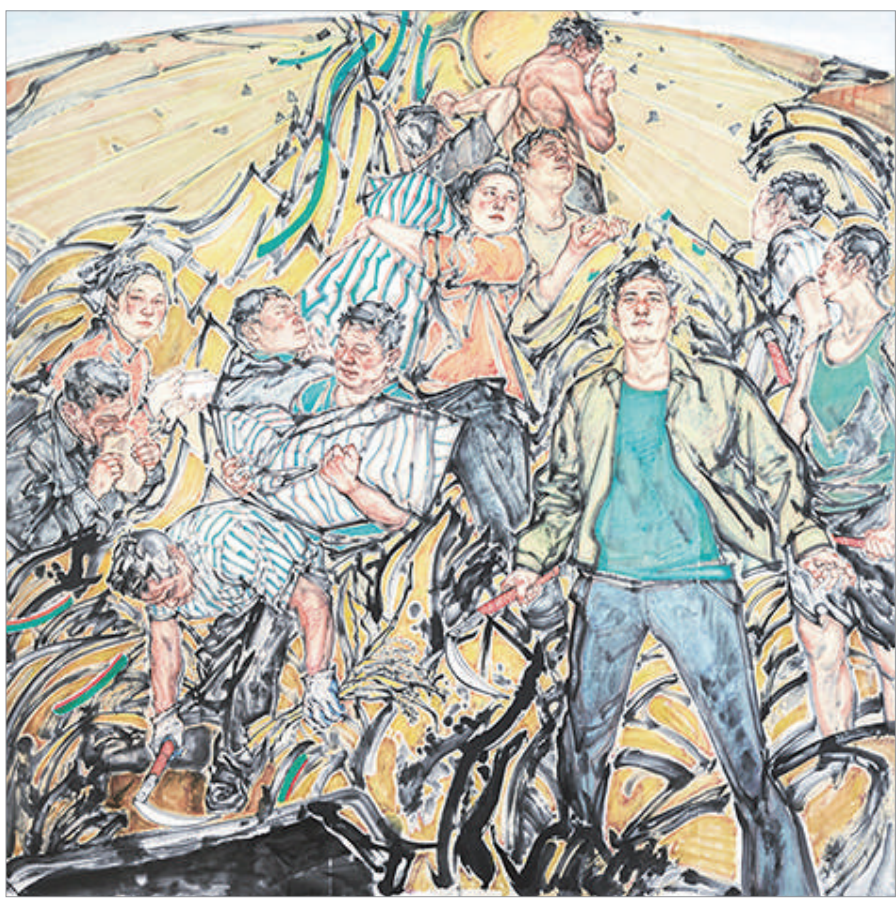
金色土地 (国画) 沈晓明 作

本报从“庆祝中华人民共和国成立75周年——第十四届全国美术作品展览进京作品展”中选登部分作品以飨读者。