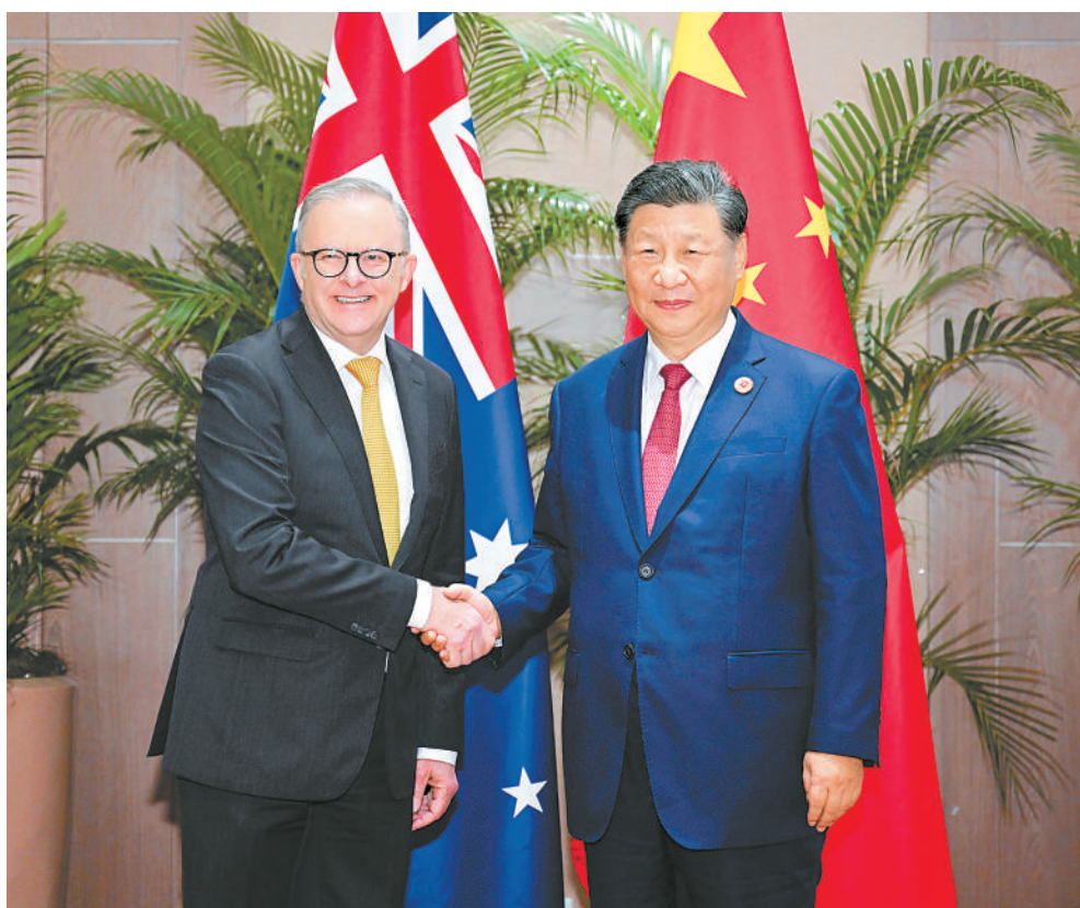
当地时间11月18日上午，国家主席习近平在里约热内卢出席二十国集团领导人峰会期间会见澳大利亚总理阿尔巴尼斯。