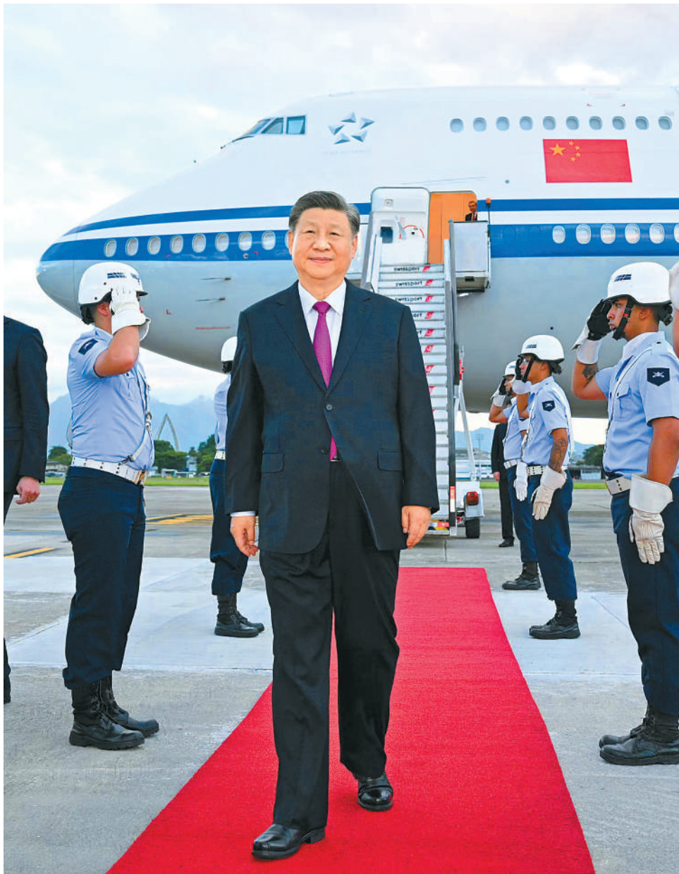
当地时间11月17日下午，国家主席习近平乘专机抵达里约热内卢，应巴西联邦共和国总统拉谢特邀请，出席二十国集团领导人第十九次峰会并对巴西进行国事访问。